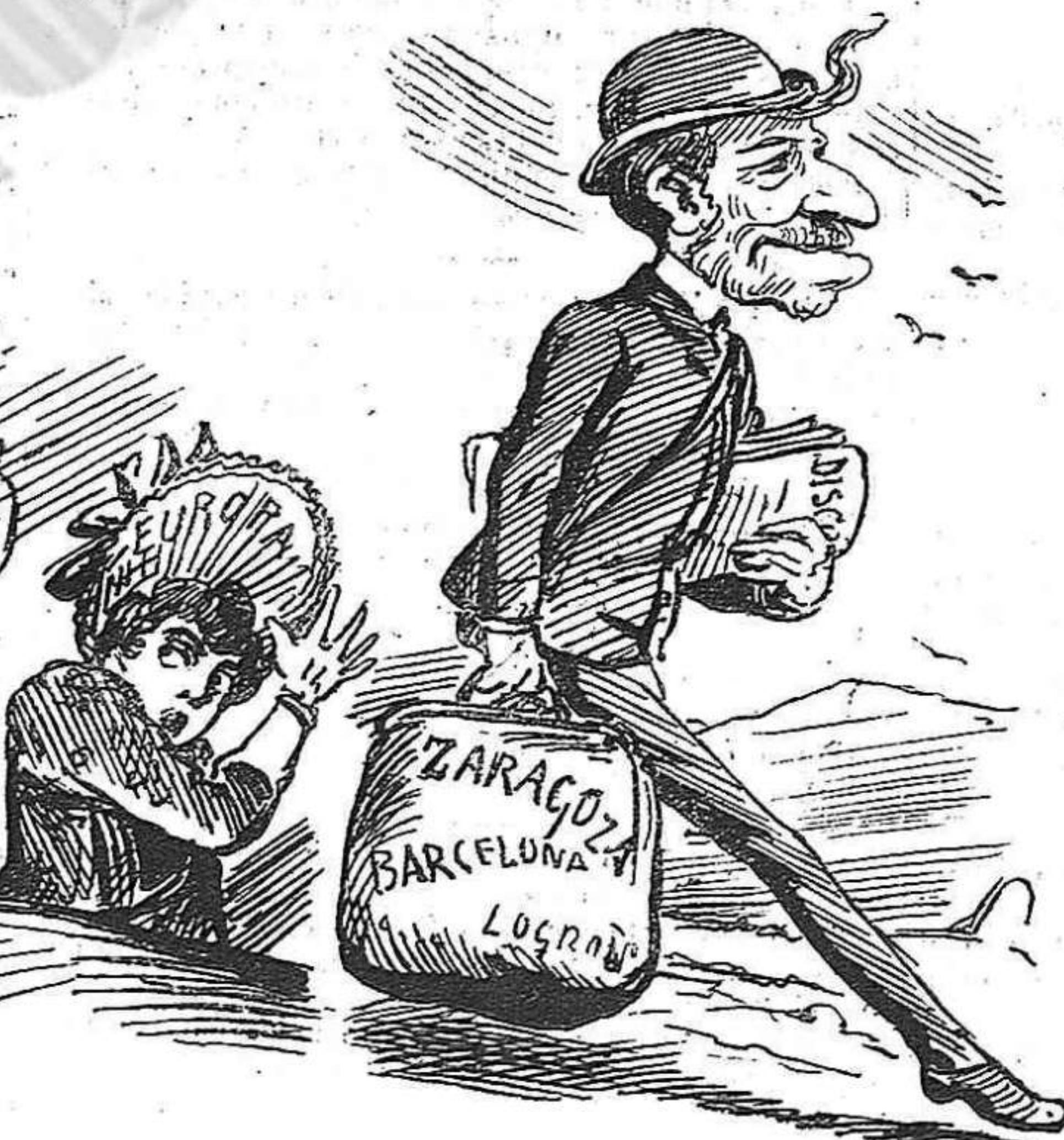
Si sab extrenyer bé 'l puny y vol, pot arribar lluny!