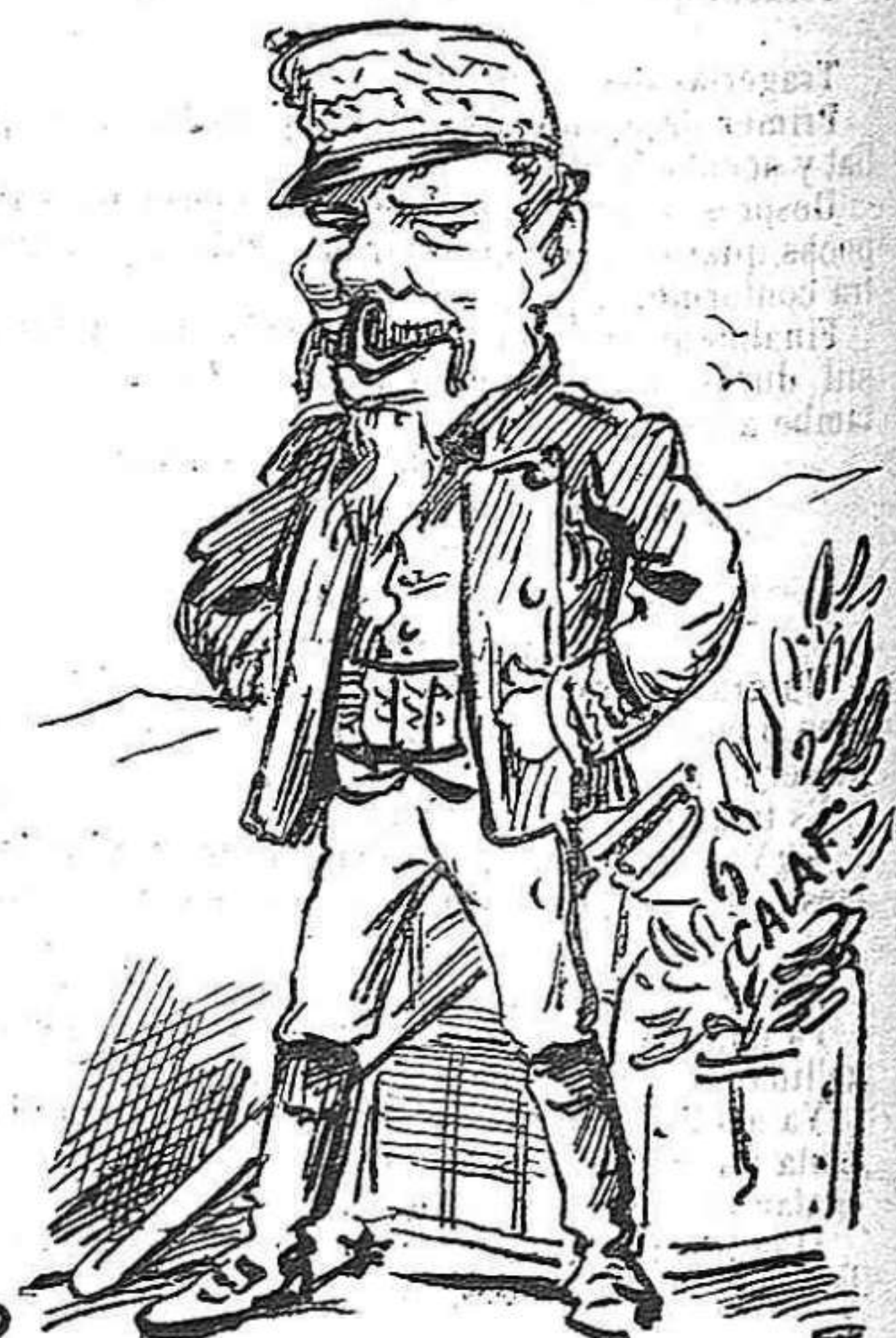
Y aquest ni sab hont anà, ni 'l que 's pesca, ni 'l que 's fá.