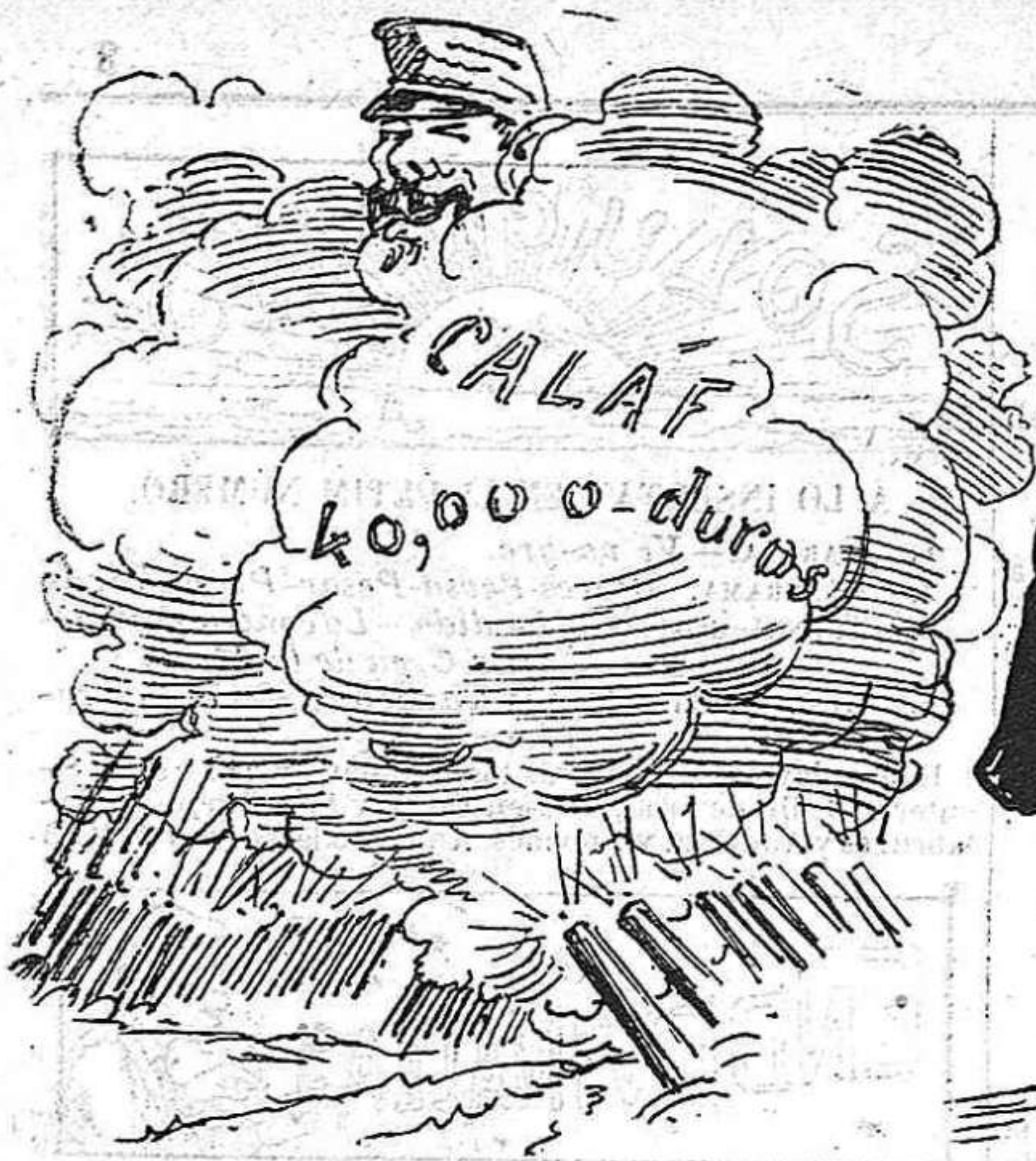
Simulacro: ¡Pim! ¡Pam! ¡Pum! ¡Tot s' ho van gastar en fum!