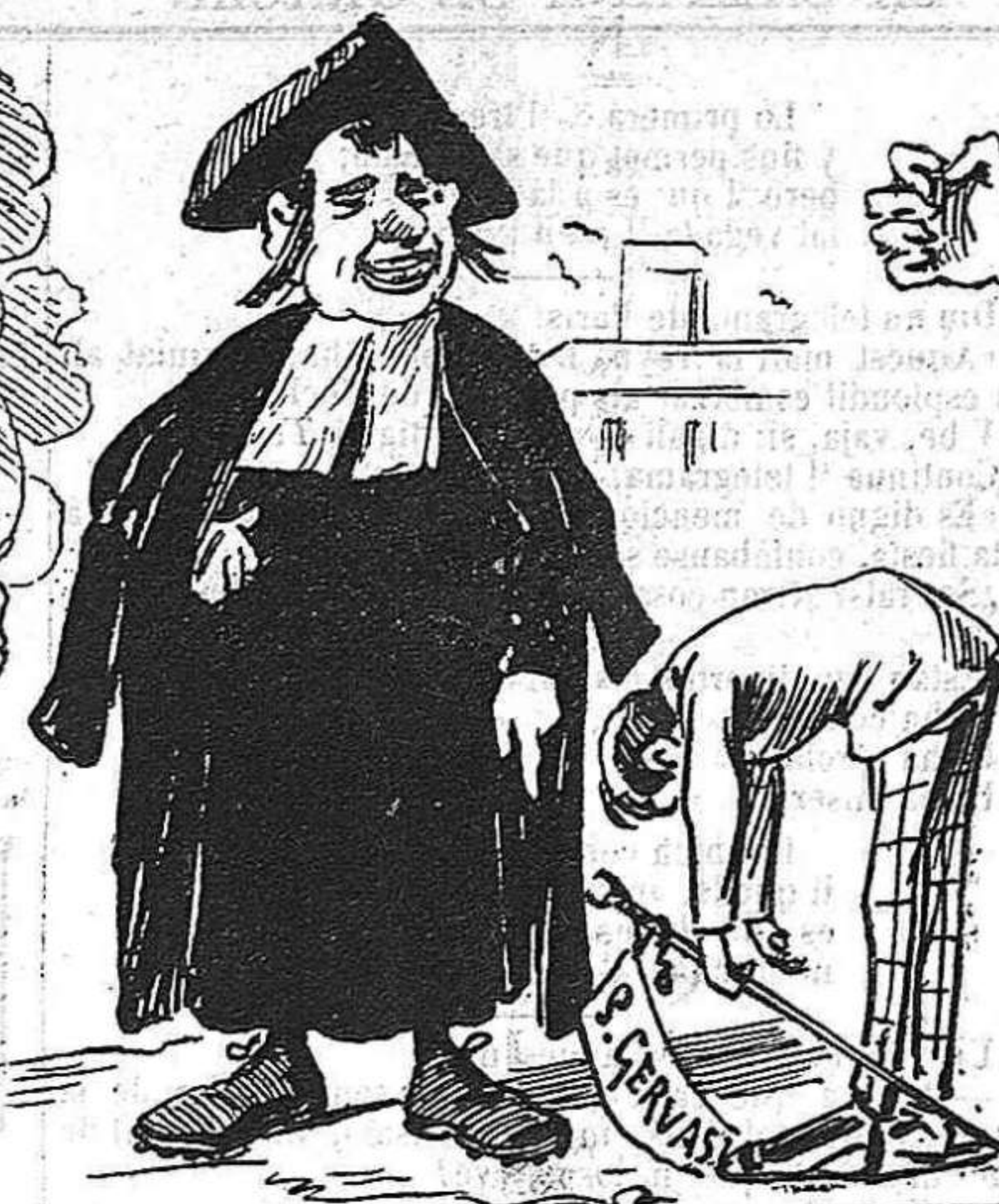
Un arcalde que s' inclina als germans de la Doctrina.