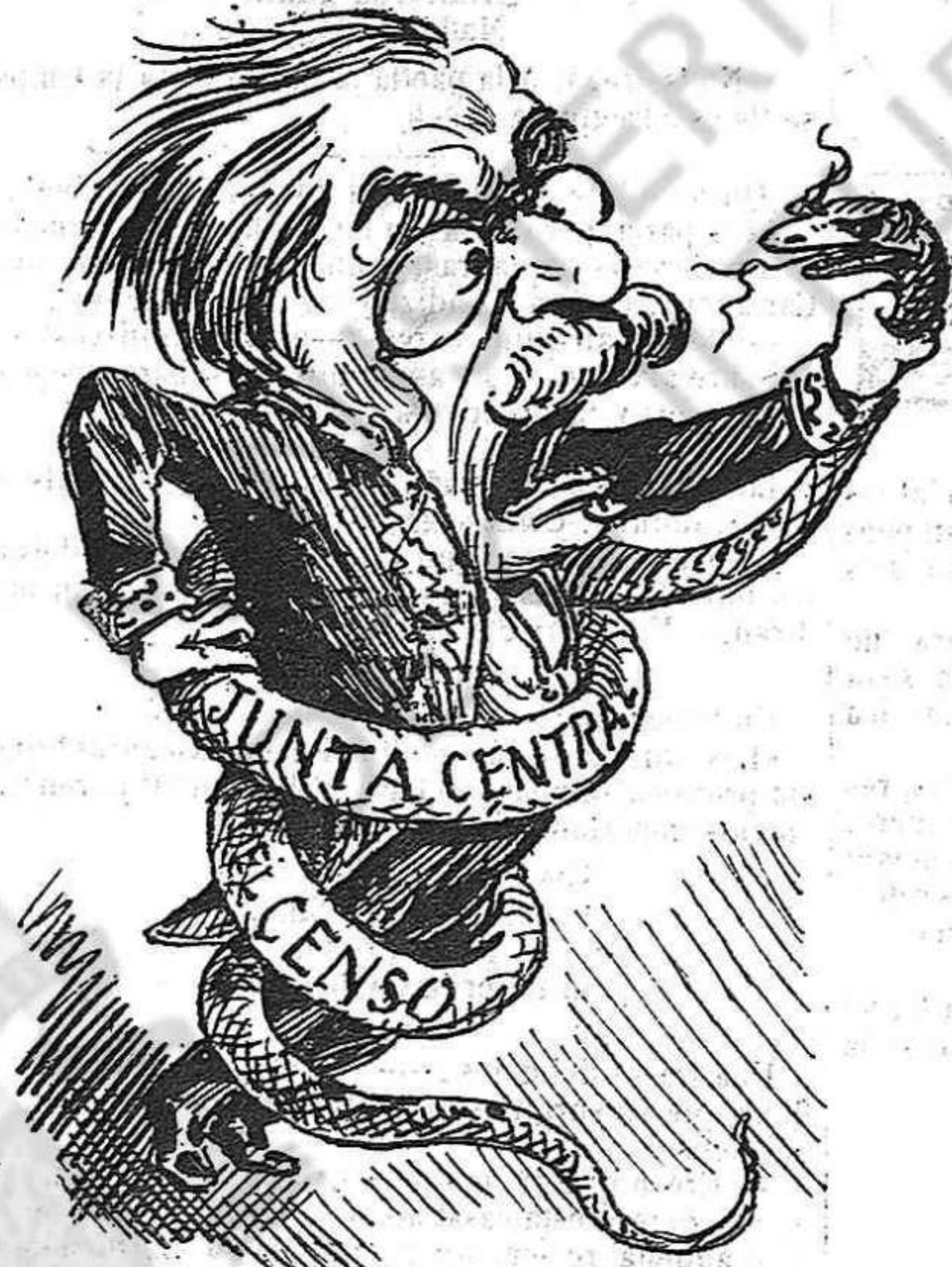
¡Ay Monstruo, estás ben posal! ¡Qué te 'n veus d' embolicat!