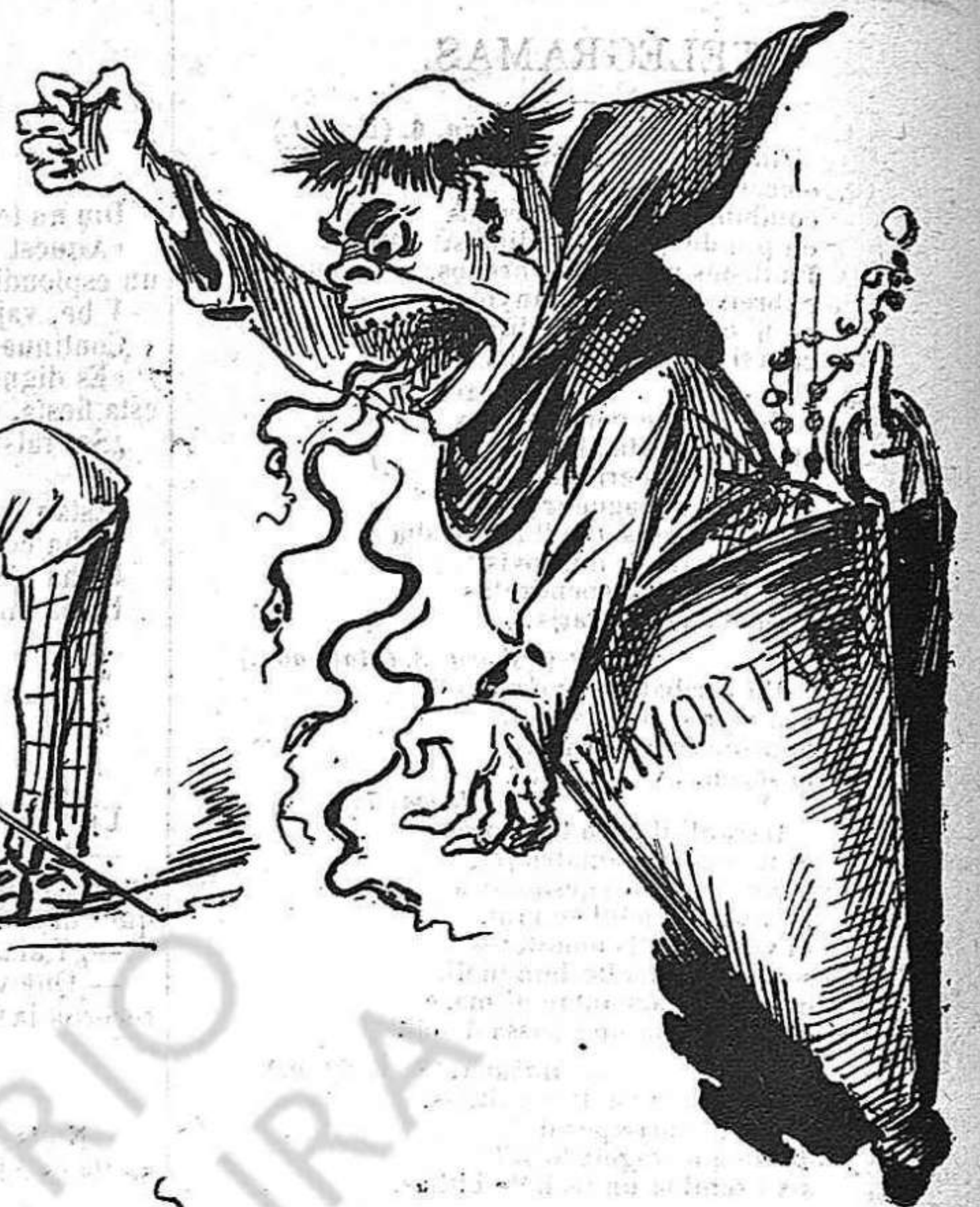
A Vigo 'l Pare Mortara s' entrega al furor de frare!