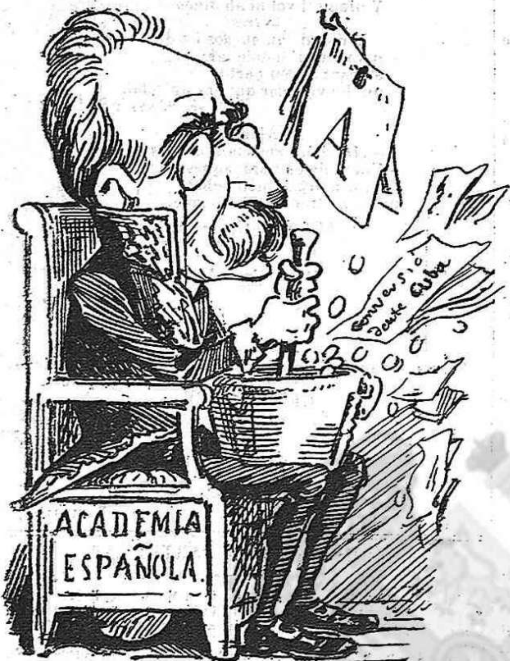
Fabié desde aquest moment limpia, fija... y pasta unguent.