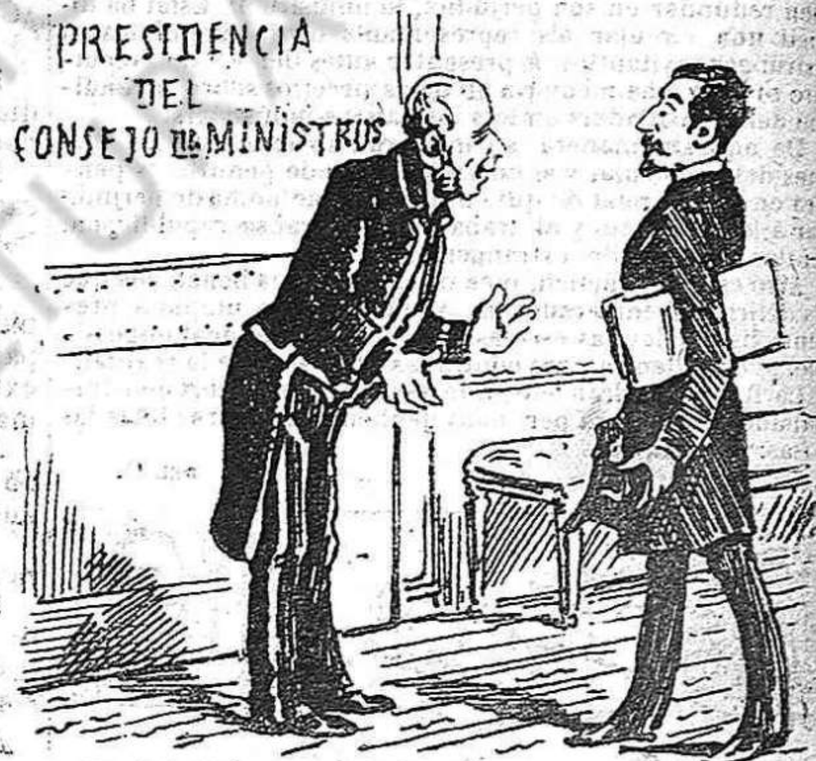
—No, senyor: avuy no hi ha consell: los minis-tres son a la corrida de toros de beneficencia.