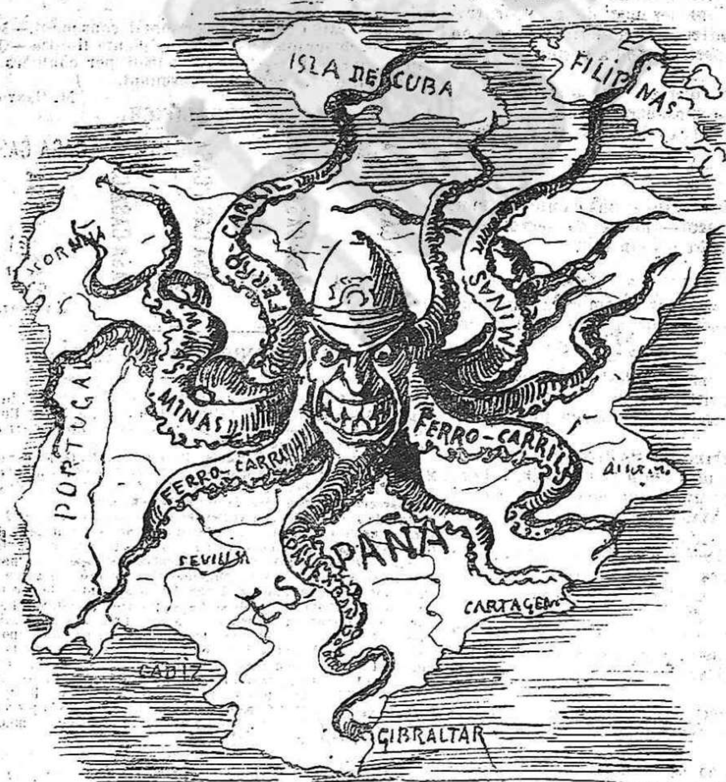
Dessidia española.—Aqui tenen lo pop que se 'ns està xuclant. Ja veurán com al últim ni 'ns podrem moure.