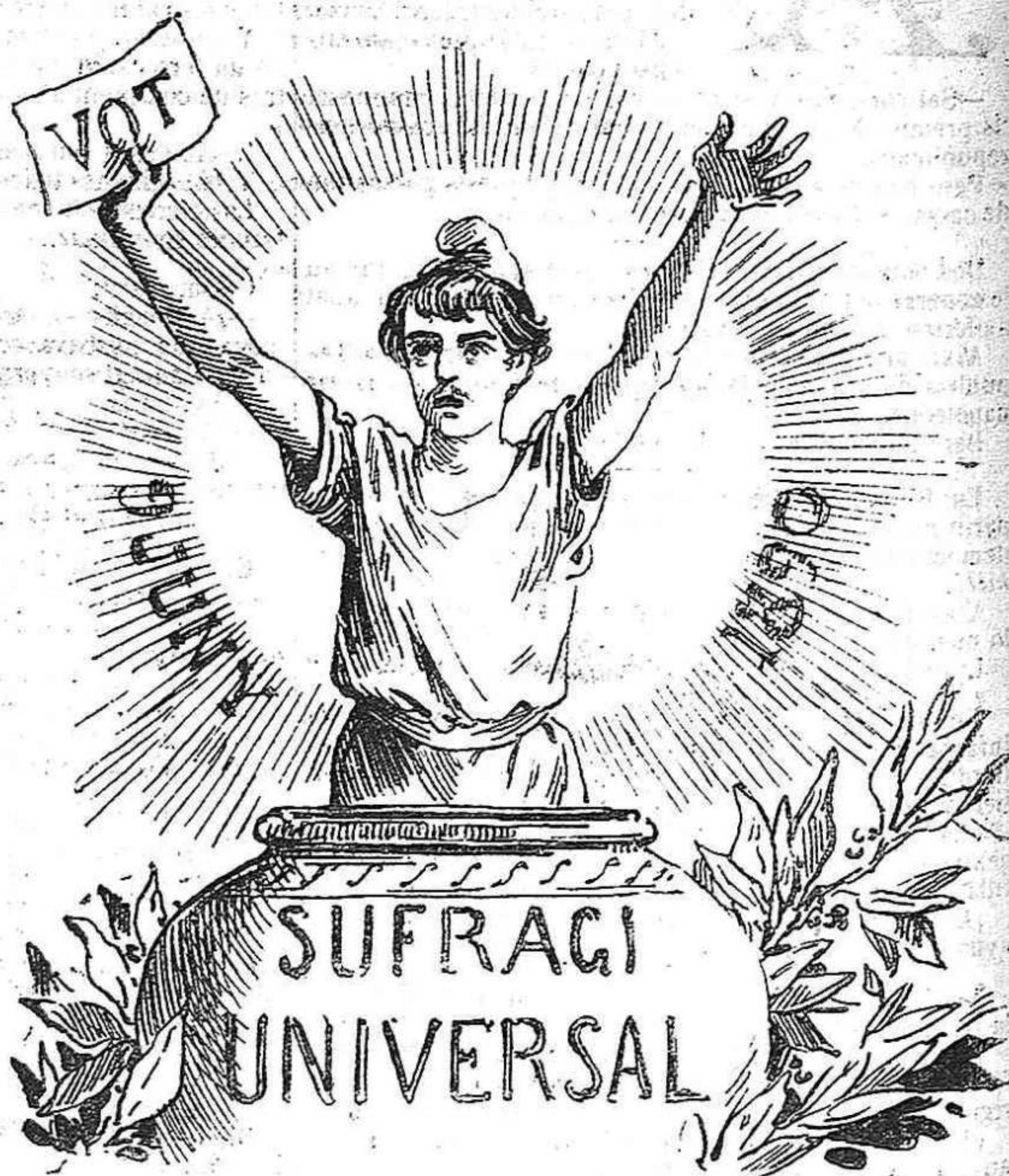
La resurrecció del poble espanyol.