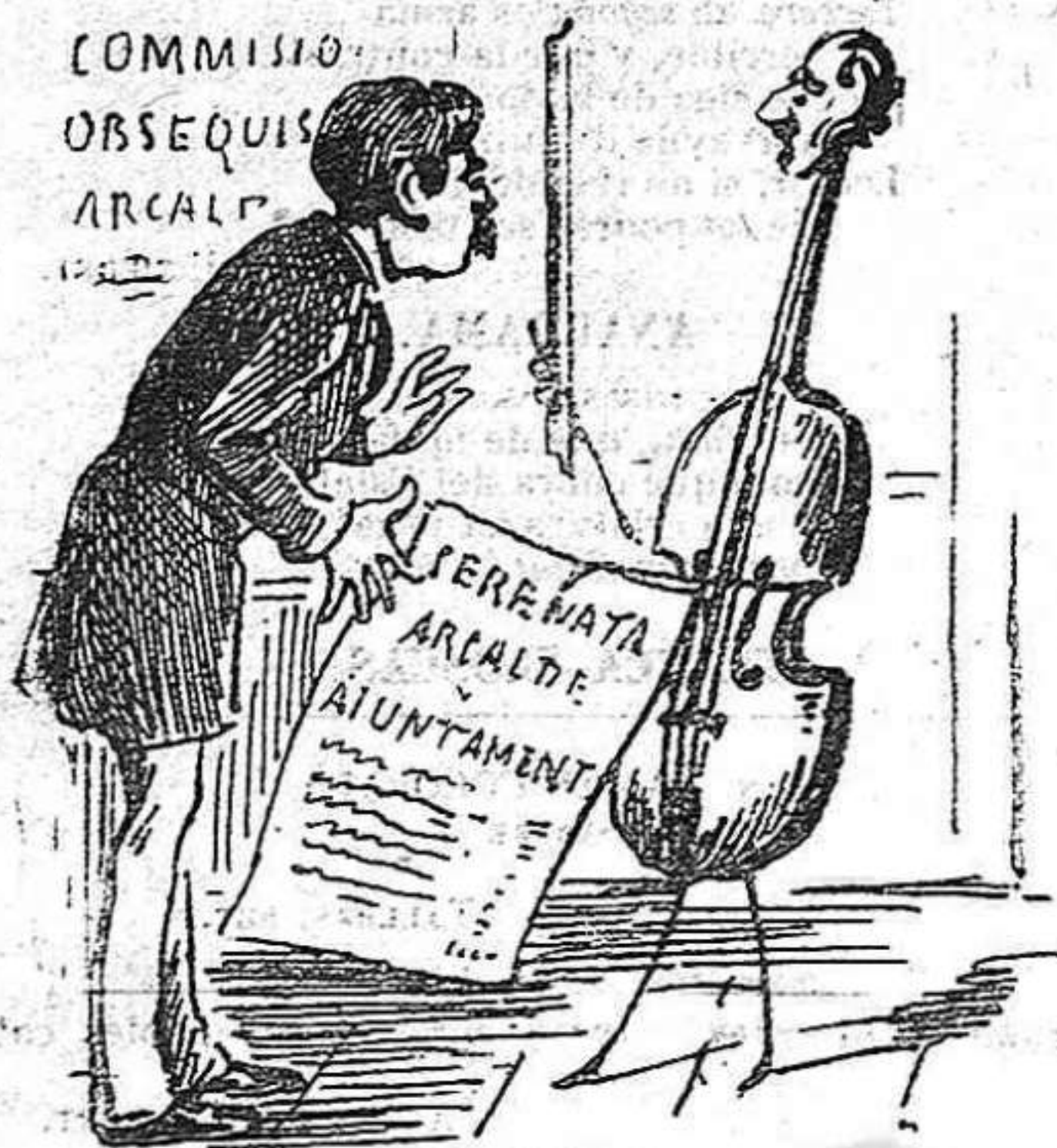
—Vostés van dir que la serenata era per l' alcalde; pero com qu' ell diu qu' es per tot l' Ajuntament, han de pagarla al doble.