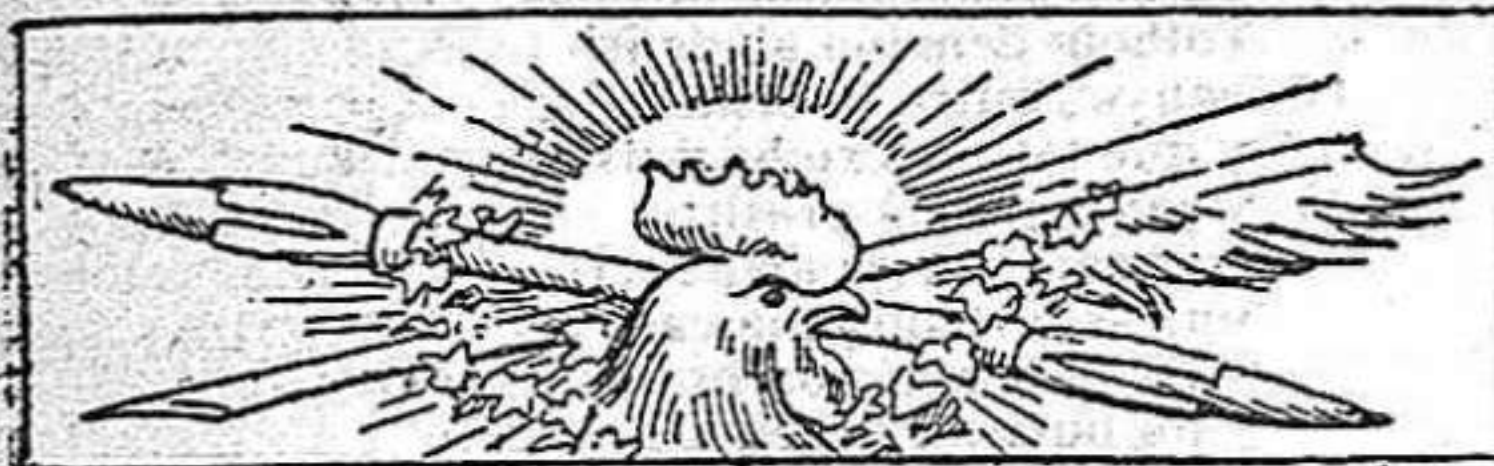
PEPE EL HUEVERO.

PREU DE SUSCRIPCIÓ: Fora de Barcelona cada trimestre ESPANYA pesetas 1'50. Cuba y Puerto-Rico, 2.—Estranger, 2'30.