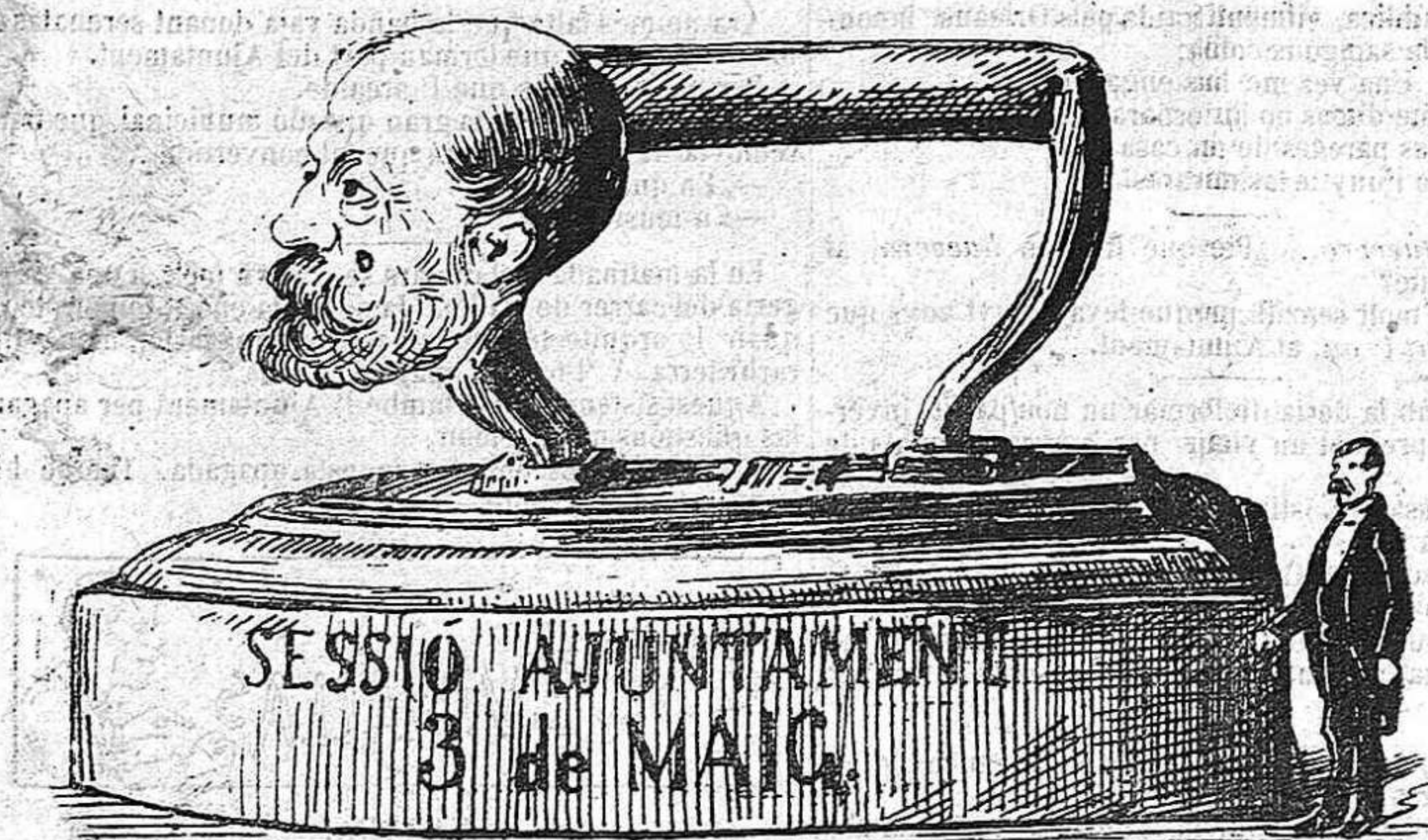
Barcelonins, ¡mirin qu' es grossa!