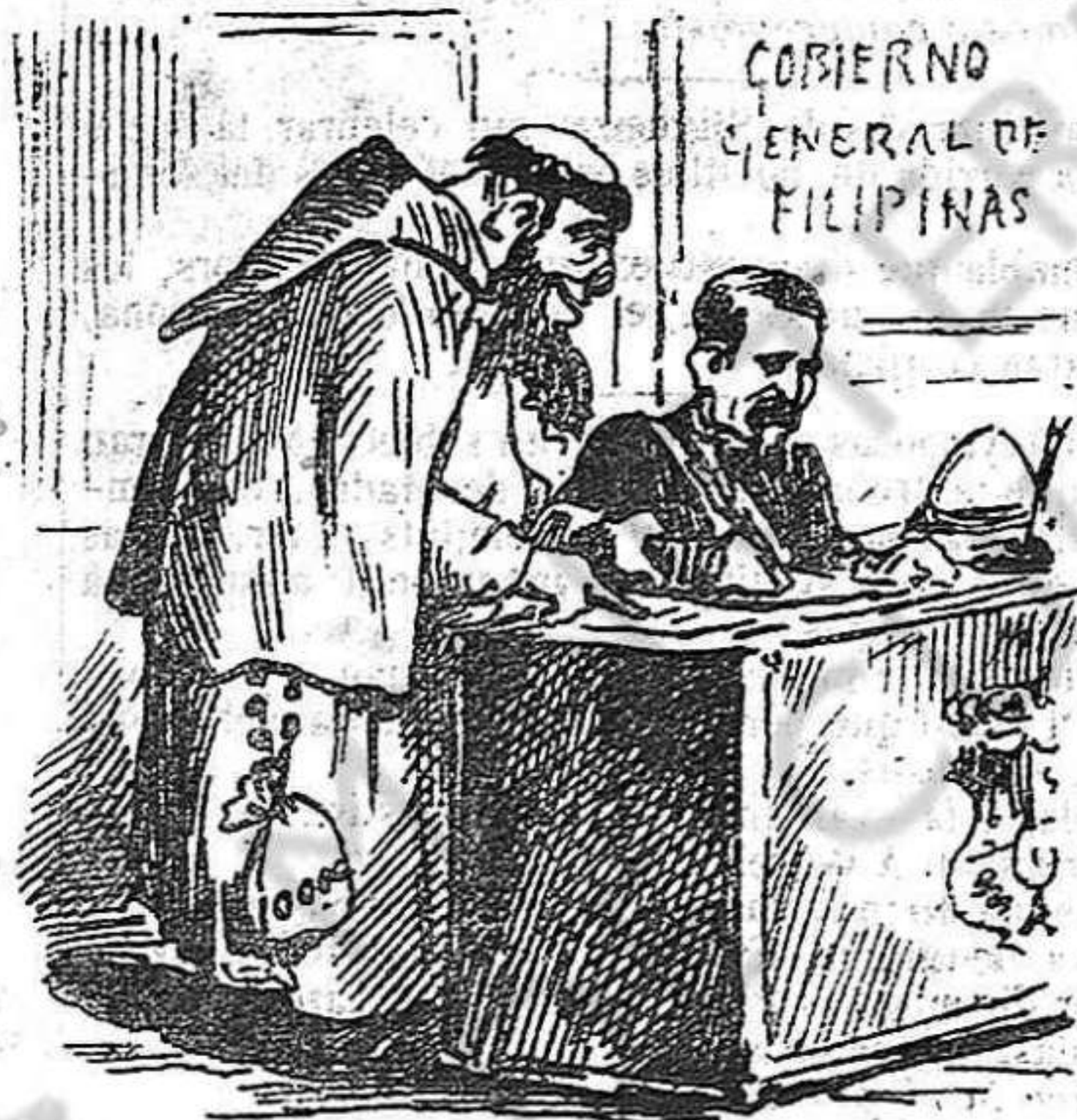
Lo gòbern de Filipinas.—Nosaltres prou hi enviem generals; pero los únichs que manan, son los pares generals de las comunitats de frares.