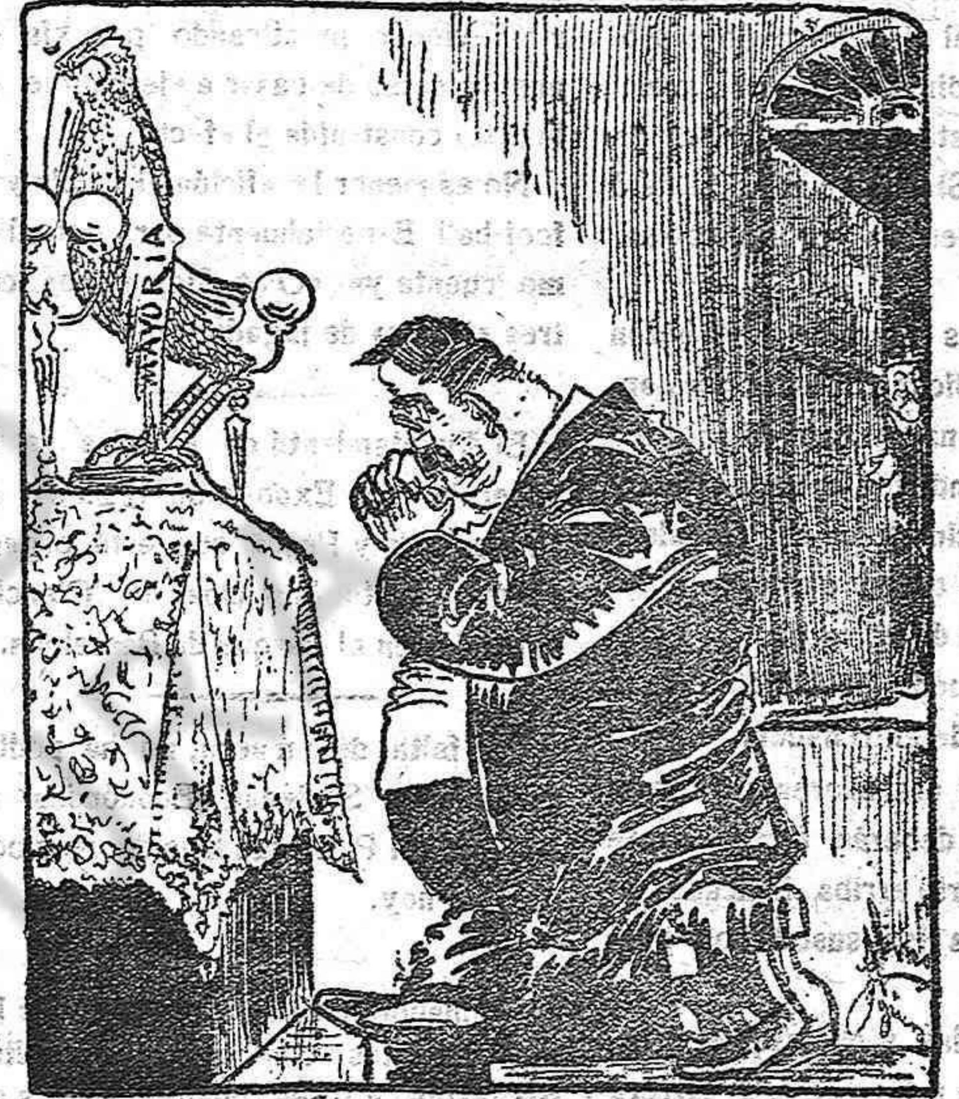
Con el «santo» de espaldas.

plaza! Padres recios y malvados, temblad. La cuenta que se os exigirá en el tribunal de Cristo será muy rigurosa.