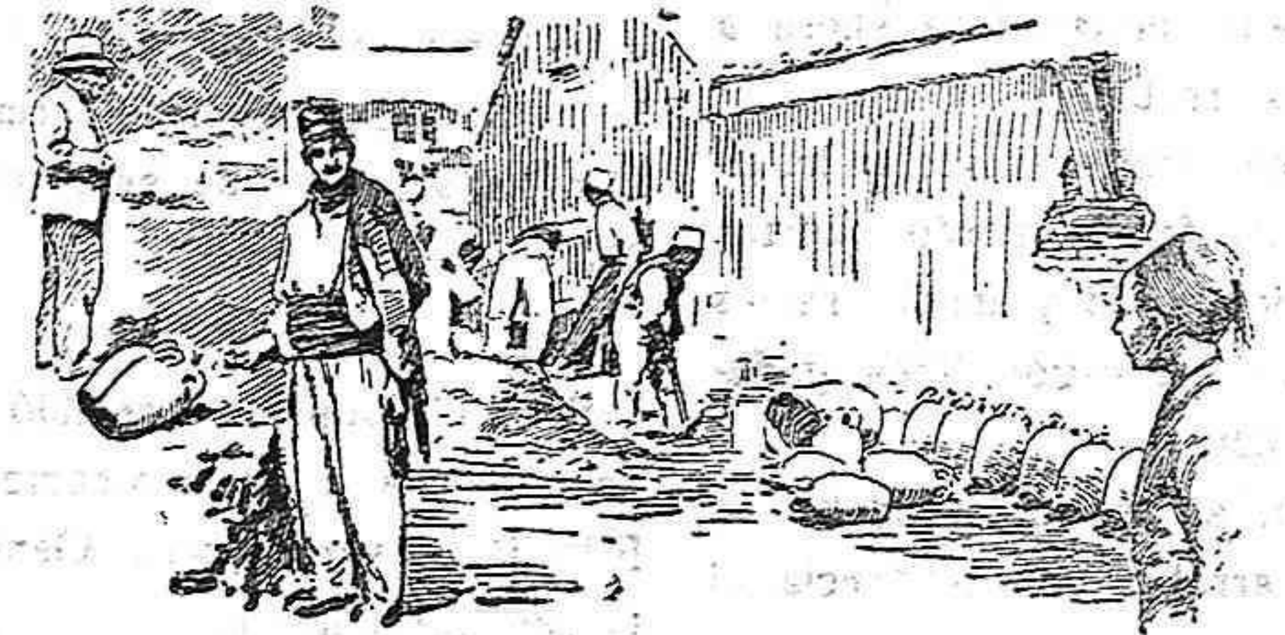
Mercado de alfarería en Trípoli

Estamos seguramente en víspera de grandes realidades. Dejamos entrever ya algo de esto en nuestra hoja anterior, y día vendrá en que podamos revelar al público todos los comprobantes de las esperanzas de hoy.