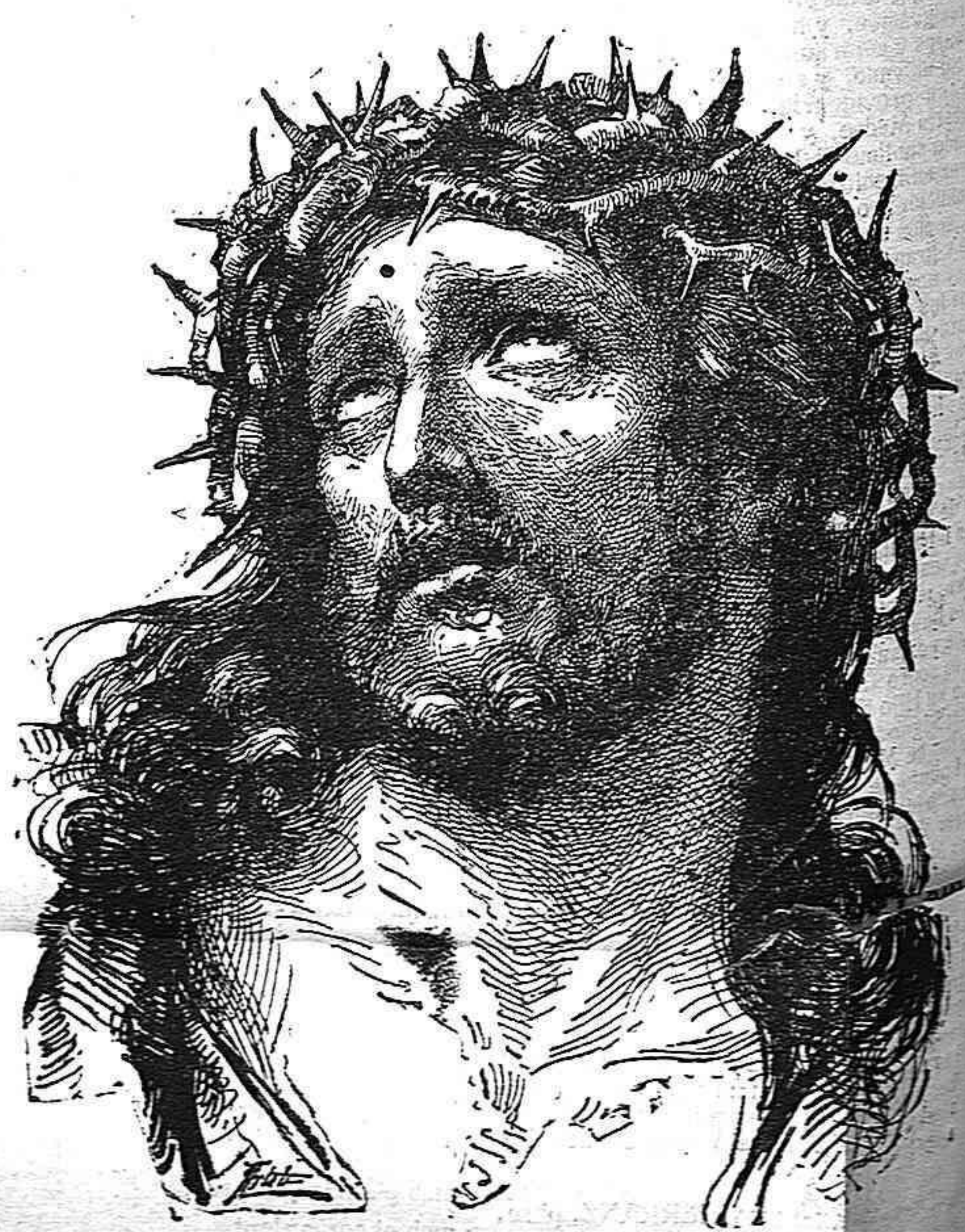
Hermos quadro de Guis. Real