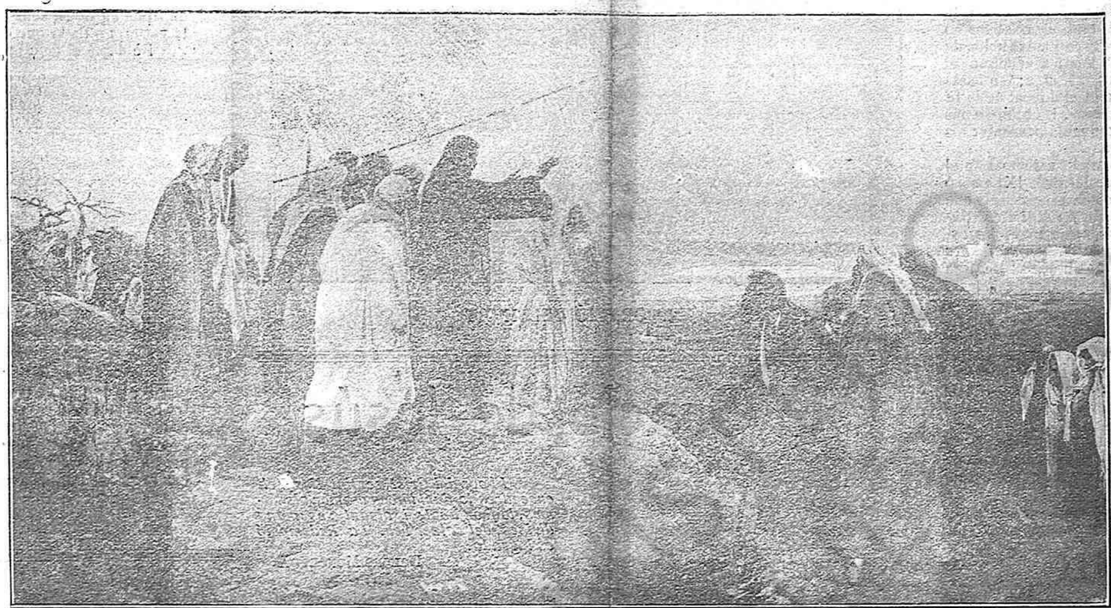
FLEVIT SUPER ILLAM