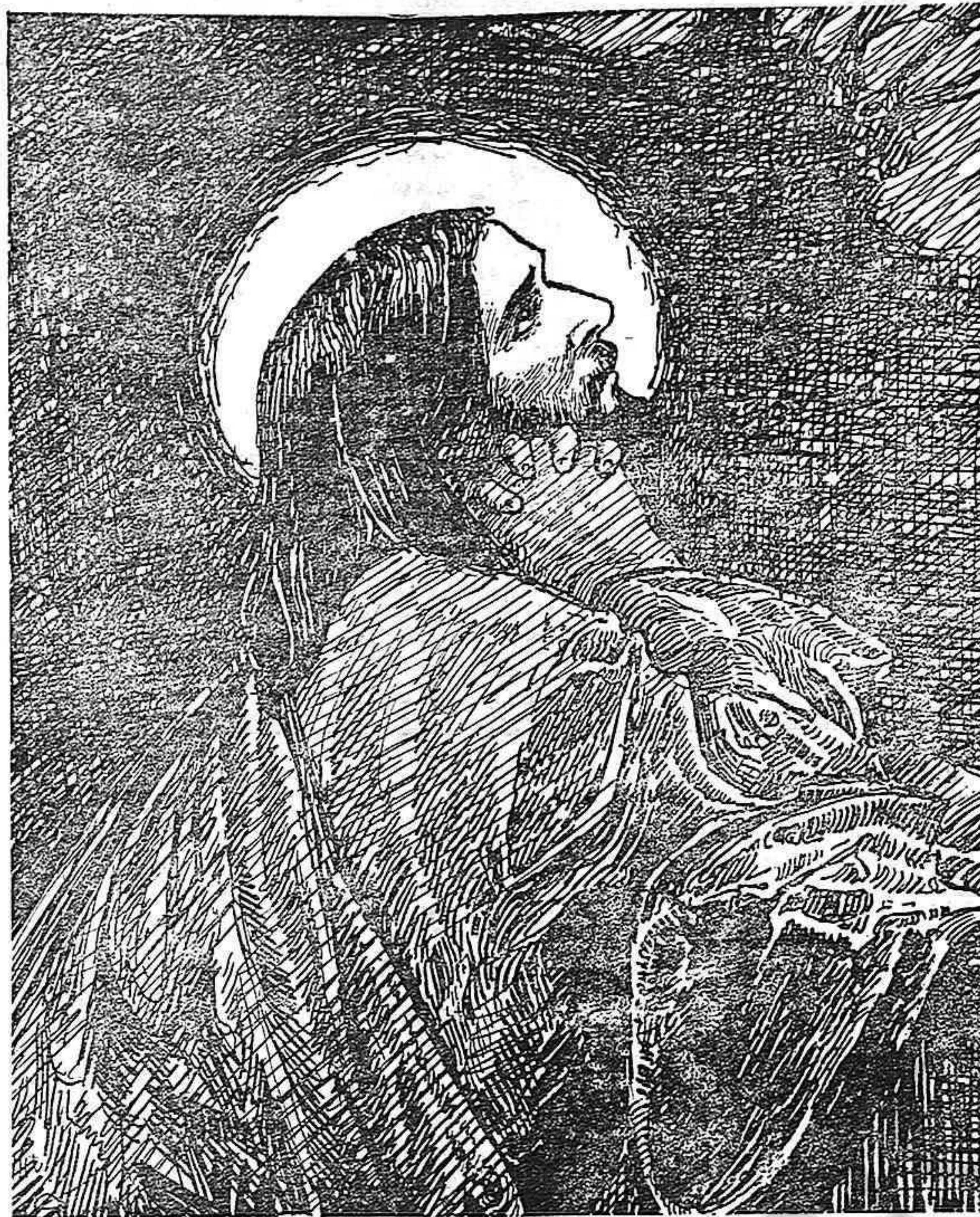
L' ORACIÓ DEL HORT