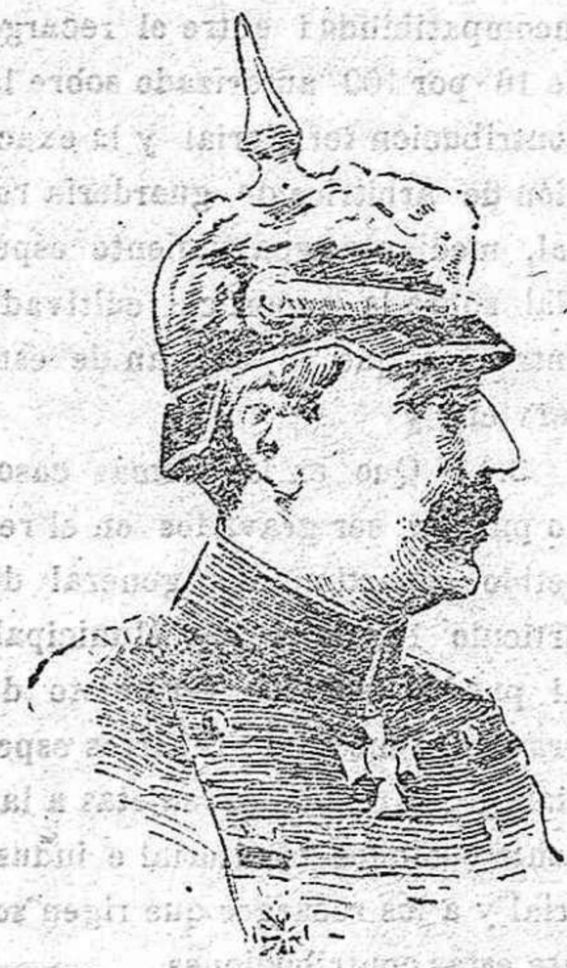
El general von Kuck que mandó el ala derecha alemana

¡Dios les bendiga! Era el más hermoso regimiento que se pudo ver.