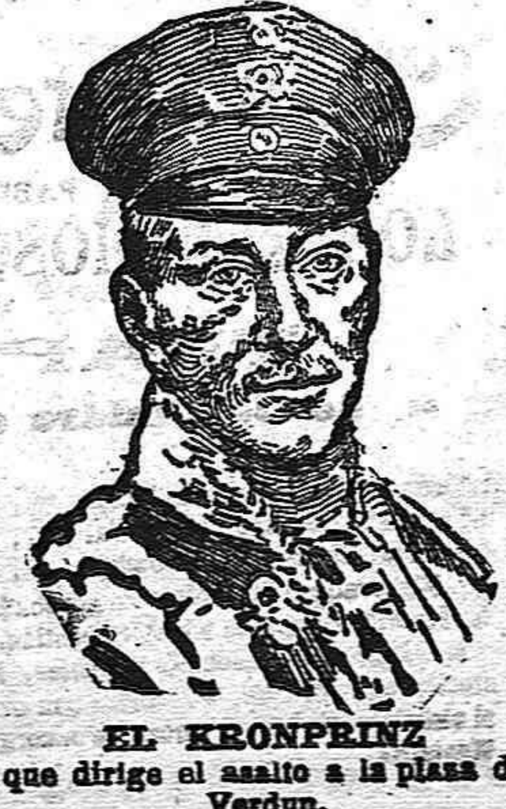
EL KRONPRINZ que dirige el asalto a la plaza de Verdun.