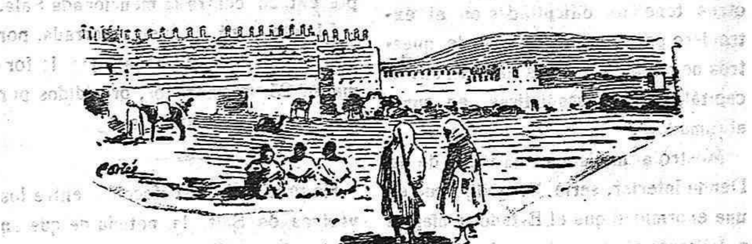
Parte de las murallas de Fez próxima a la fortaleza Bah Gula, donde los bereberes abrieron la brecha por que penetraron en la ciudad.