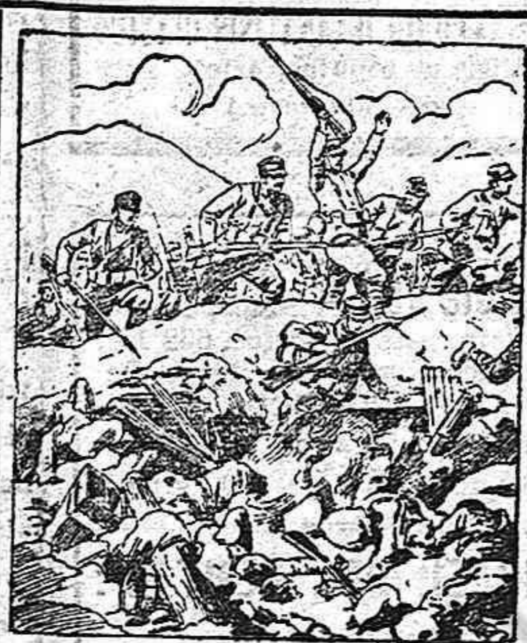
Asalto de una trinchera italiana en el Isonzo por fuerzas austriacas, después de haber sido destruida considerablemente por la artillería.

cias que habían cerrado sus puertas a la fe.