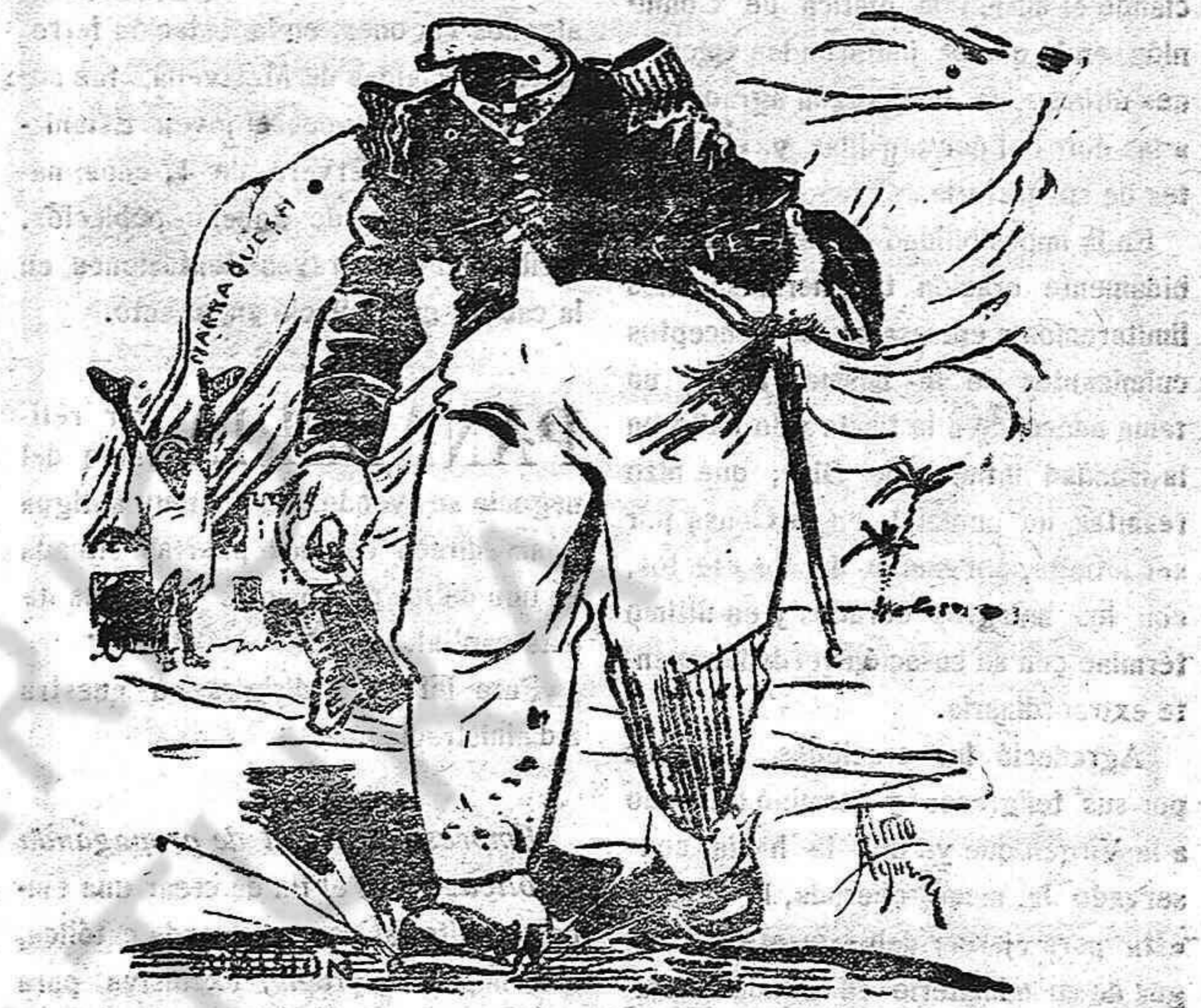
—Bueno, ahora que tengo dos prendas de cabeza ¿Dónde me las pongo?