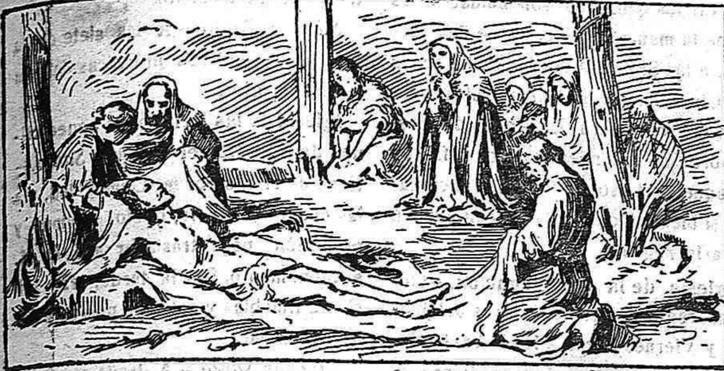
EN EL CALVARIO