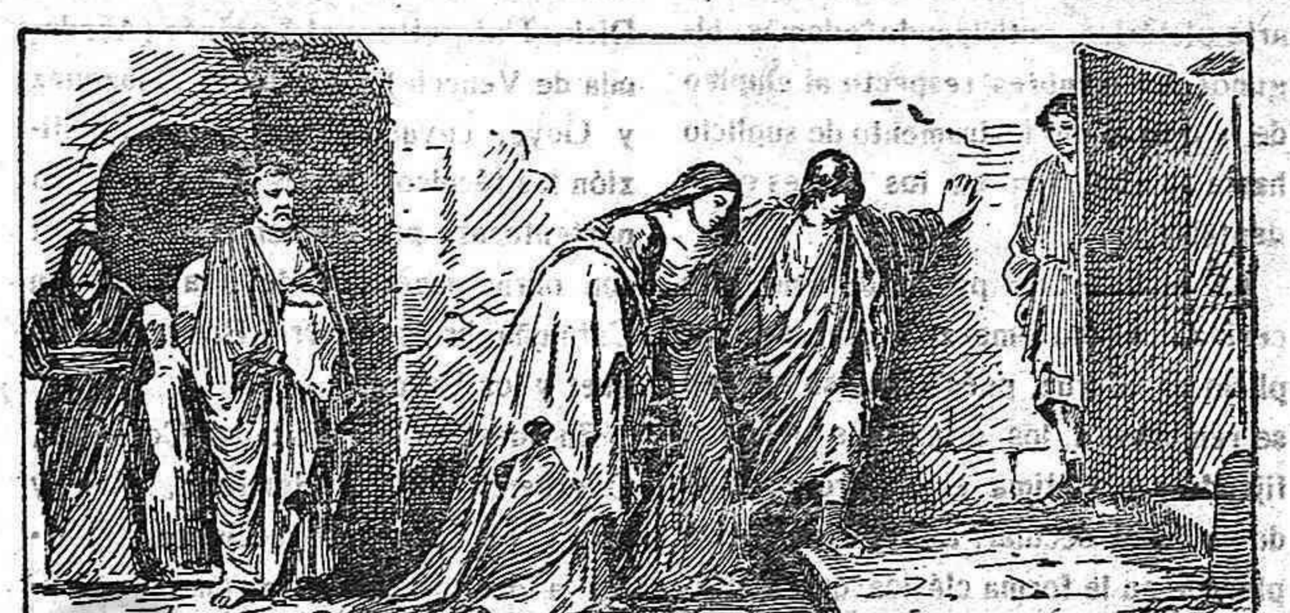
LA VUELTA DEL GÓLGOTA

Por un Pilatos que atento solamente a su medro personal, abandonó el cumplimiento de su deber, entregando a Cristo en manos de sus encarnizados enemigos; hoy fácilmente se encontra-