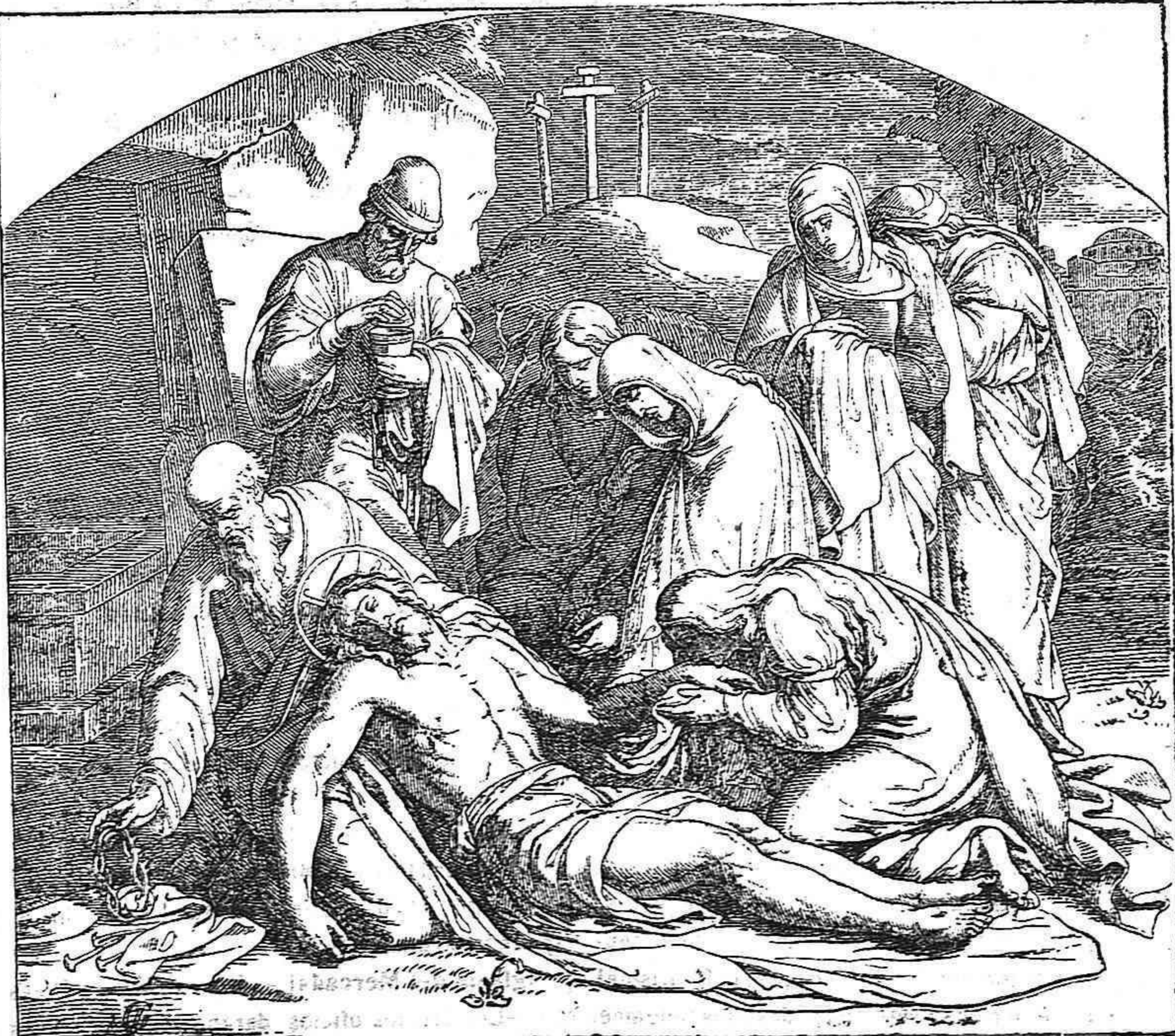
EL SANTO ENTIERRO