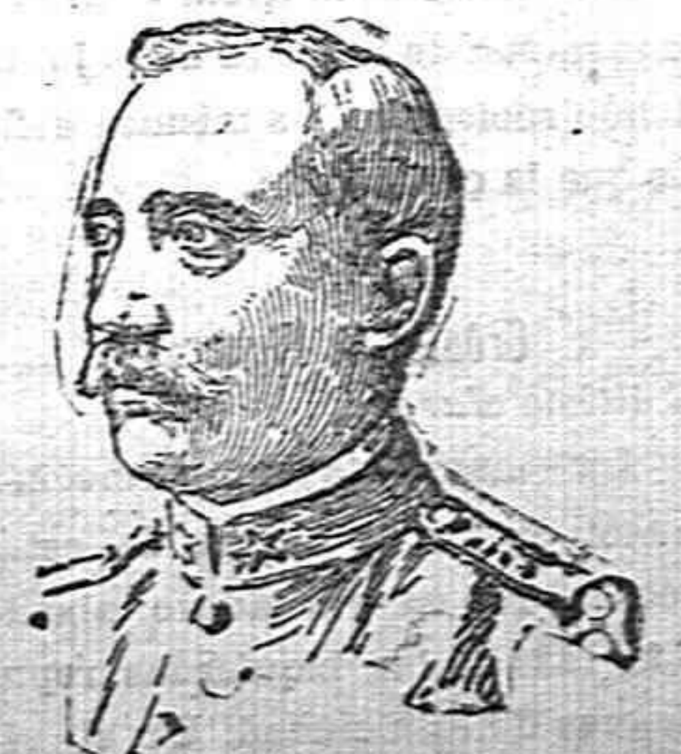
General Ameglio que manda el ejército italiano que opera contra el Tirol.