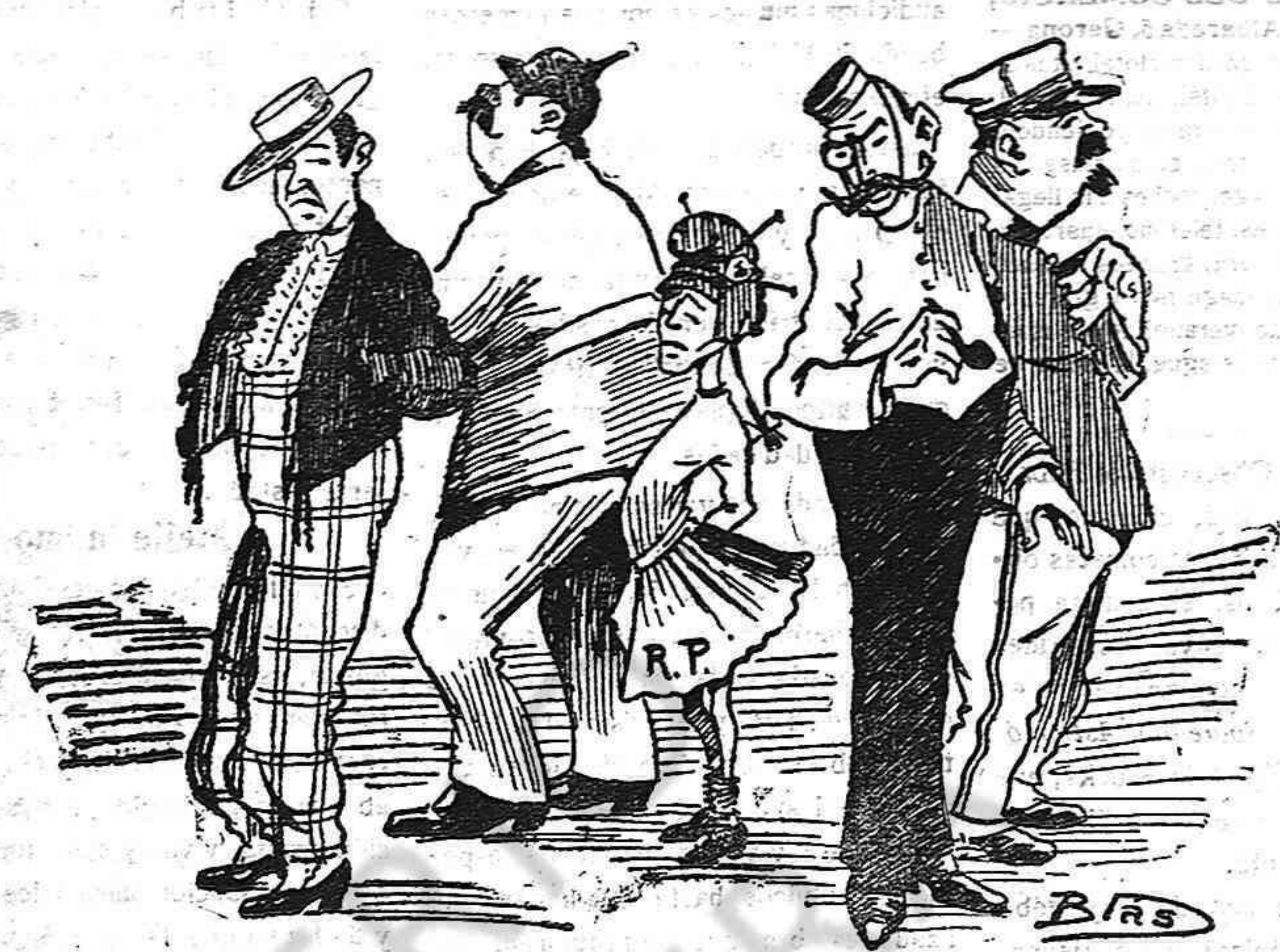
LA NIÑA.—Pero ¿porqué no me haceis caso? EL DE LA CHAQUETA CORTA.—Quítate de mi vista. ¡Mala personilla! Eres muy chiquita para ser tan cursi y prentensiosa