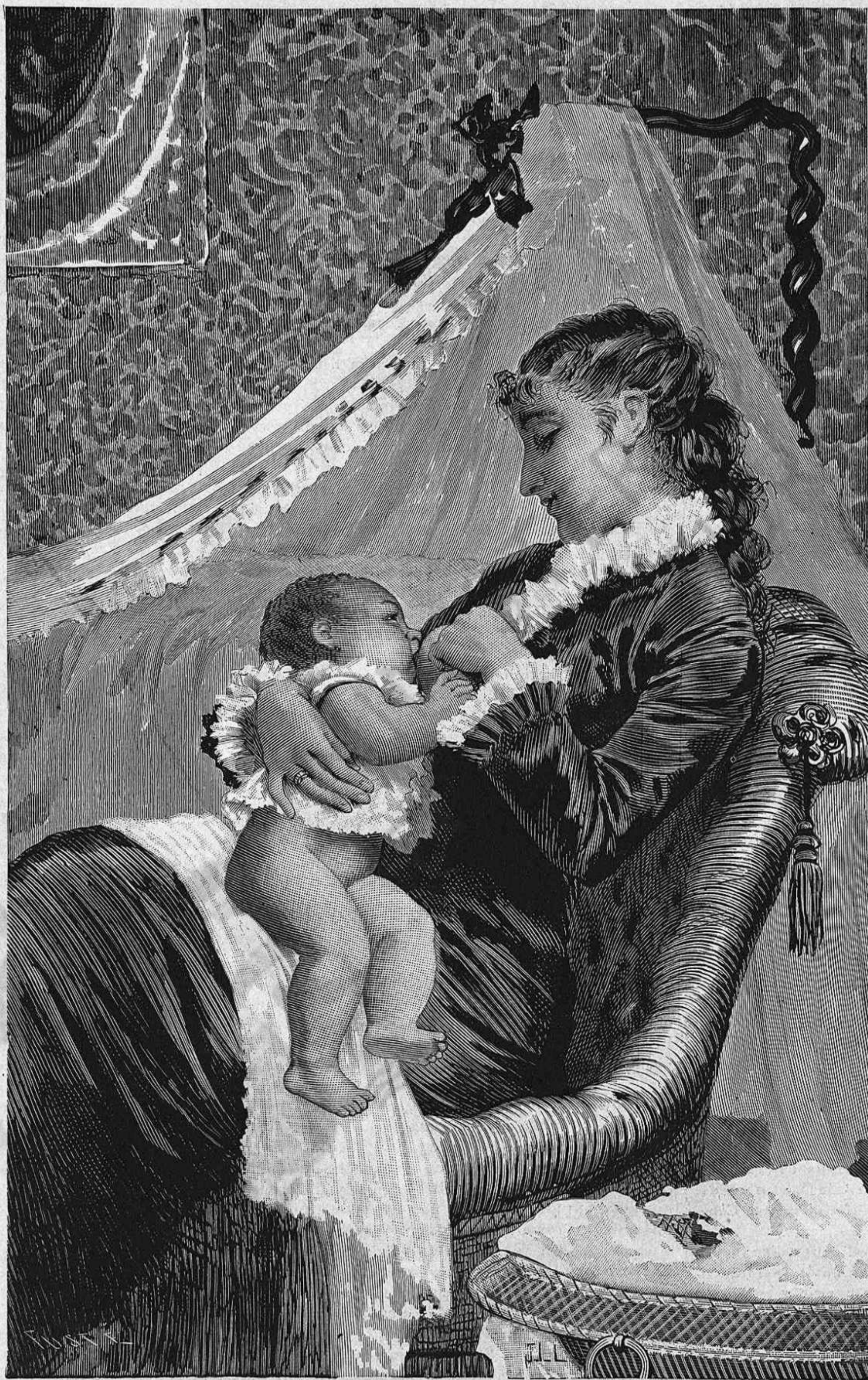
AMOR MATERNAL OUADRO DE LLOVERA.—DIBUIX DEL MATEIX