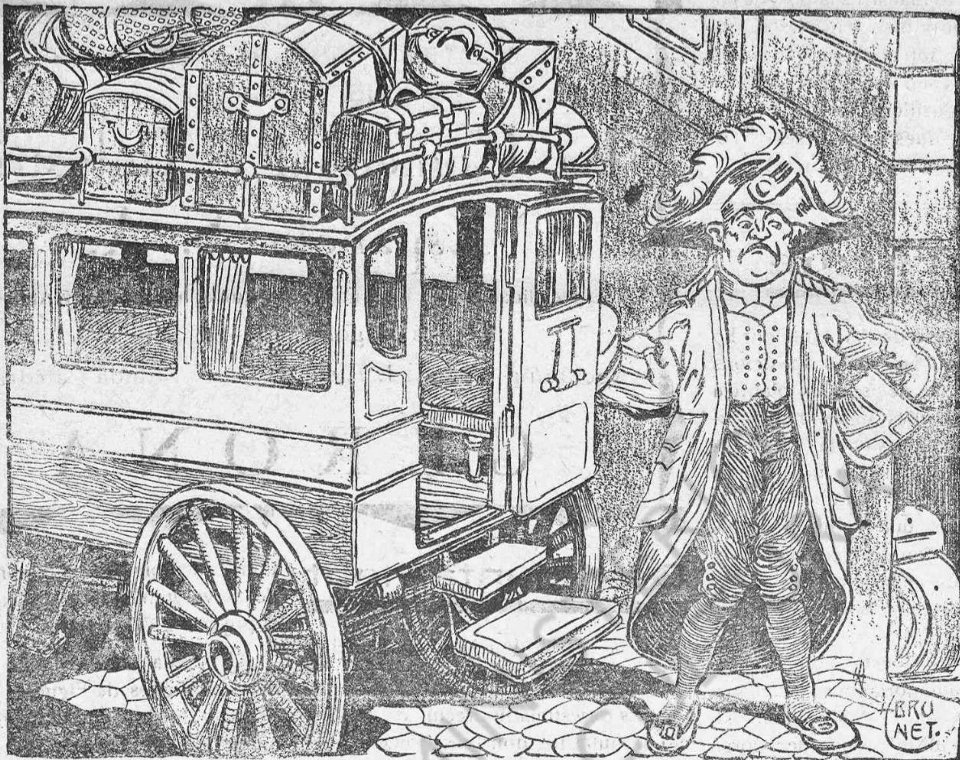
El cotxe buit i l'injustificat pànic dels rics

COM NO PODEN EMPORTAR-SE TAMBÉ LES CASES I TERRES, NO MARXARAN