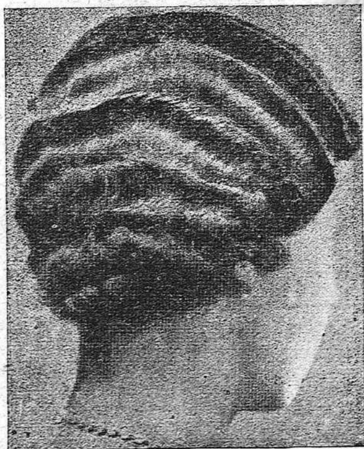
Creació de Josep S. Melció