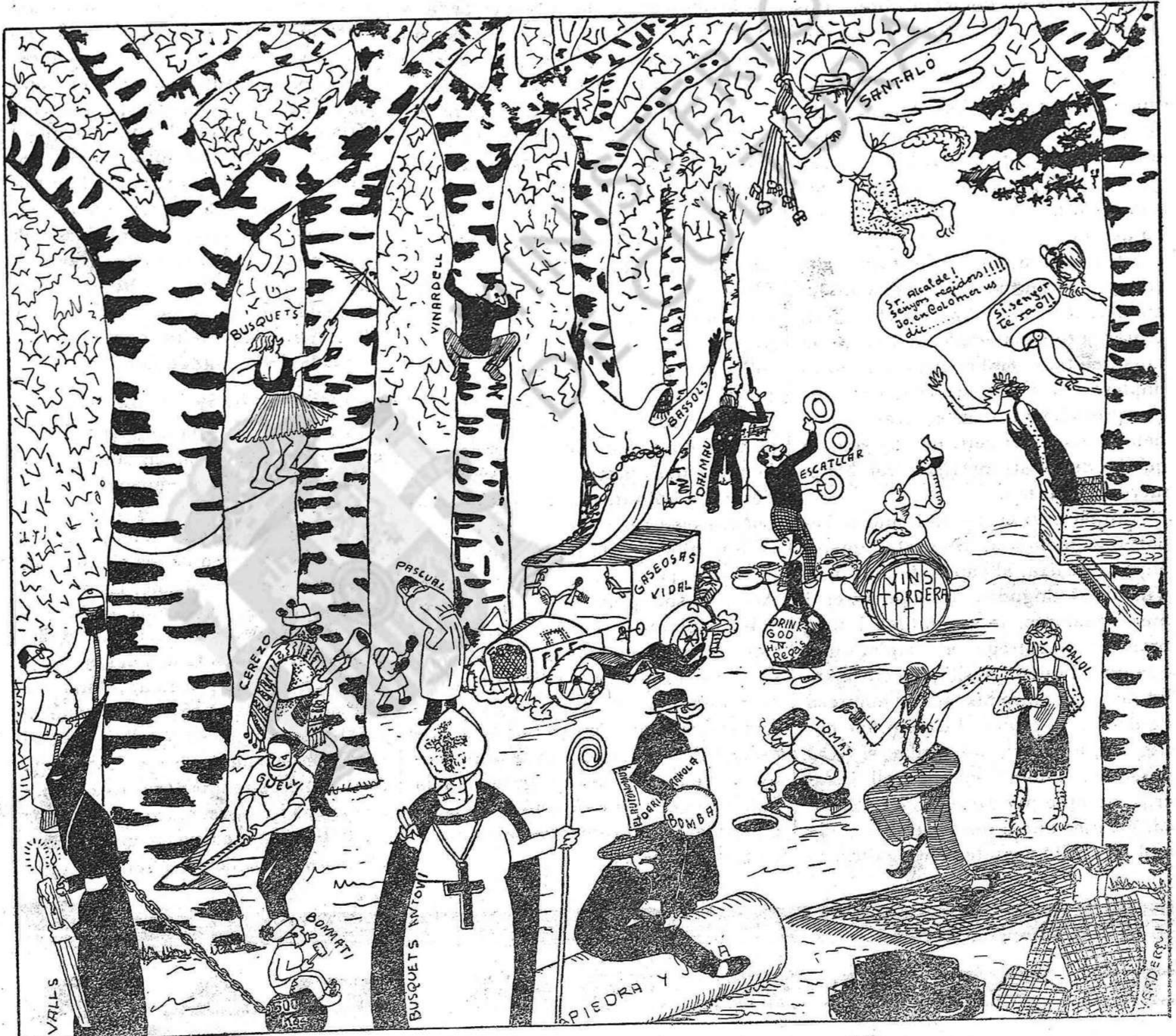
Models de disfresses per als nostres regidors