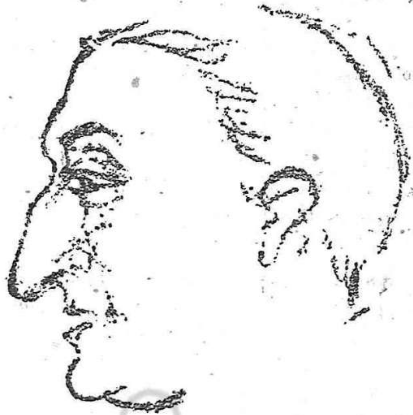
Dibuix de Ll.