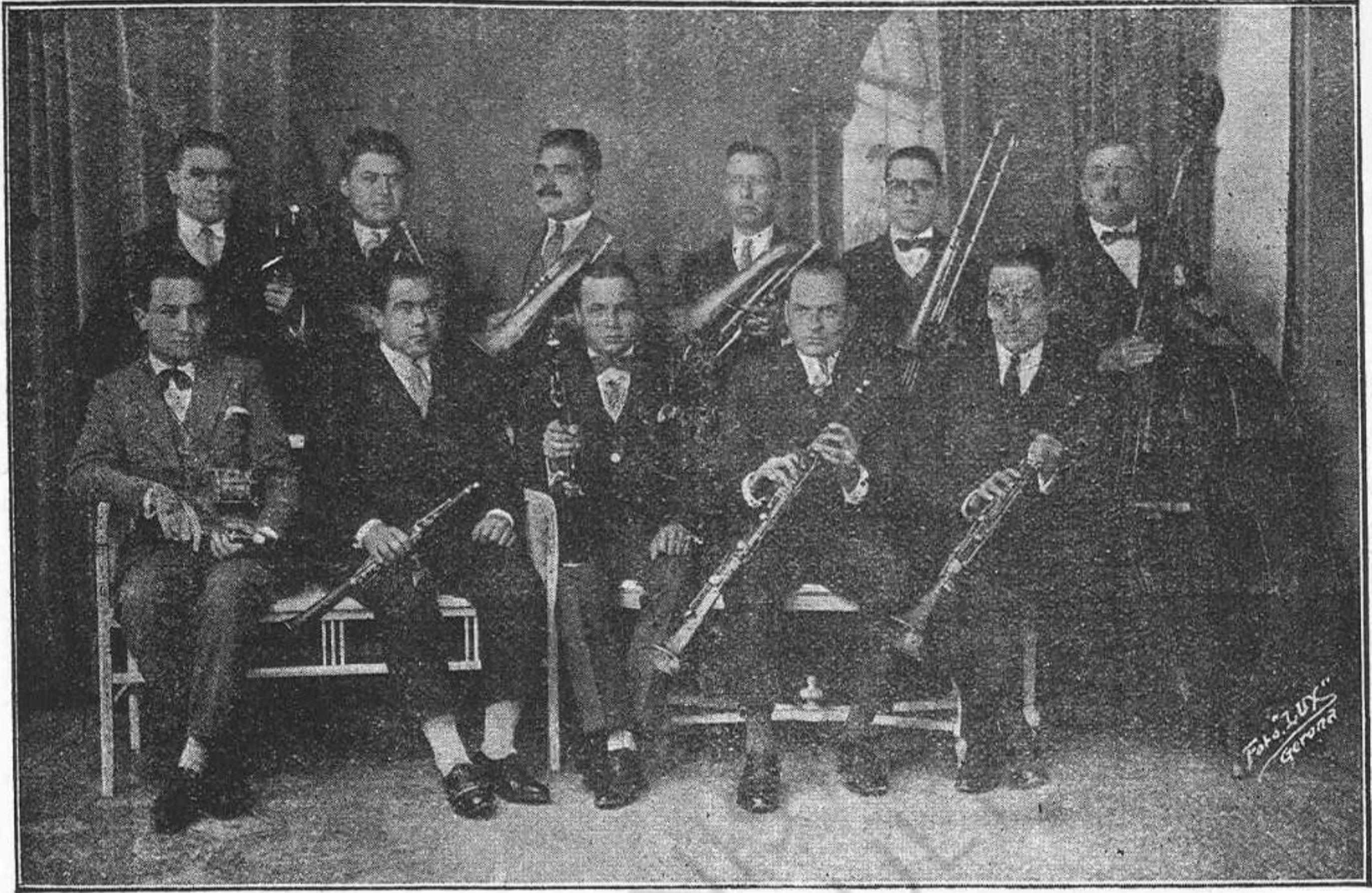
LA SELVATANA de Cassà de la Selva