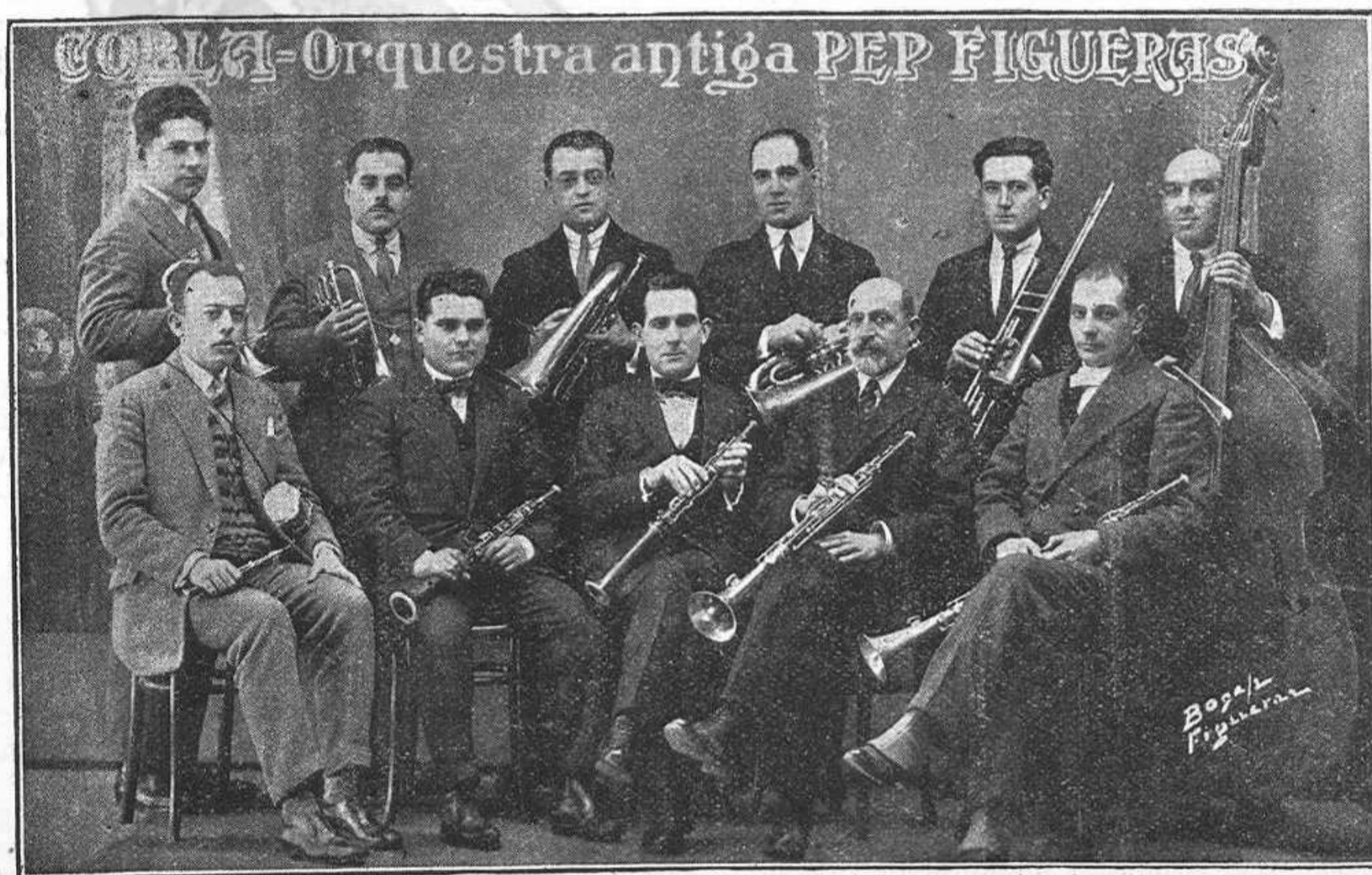
ANTIGA PEP de Figueres