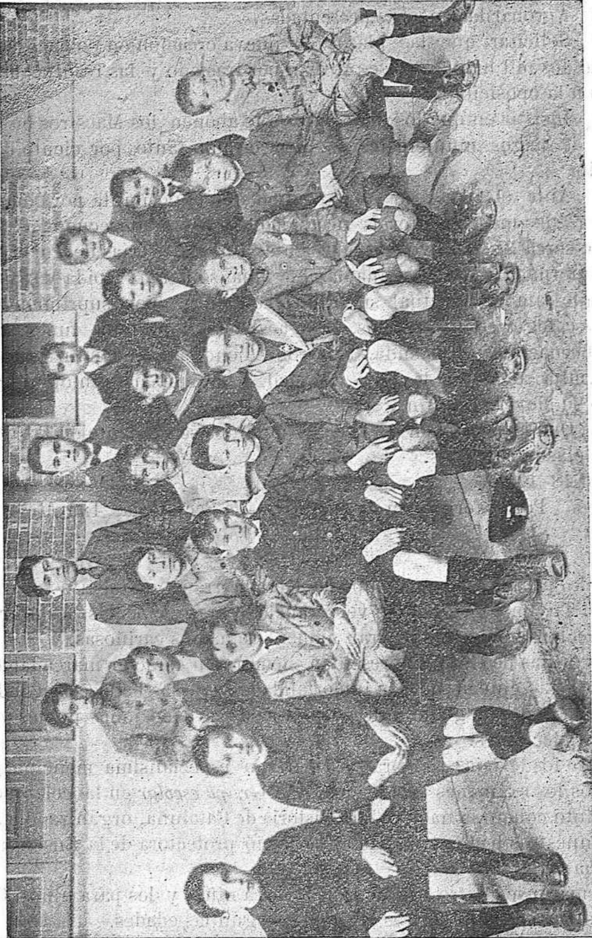
NIÑOS QUE TOMARON PARTE EN EL CONCURSO.