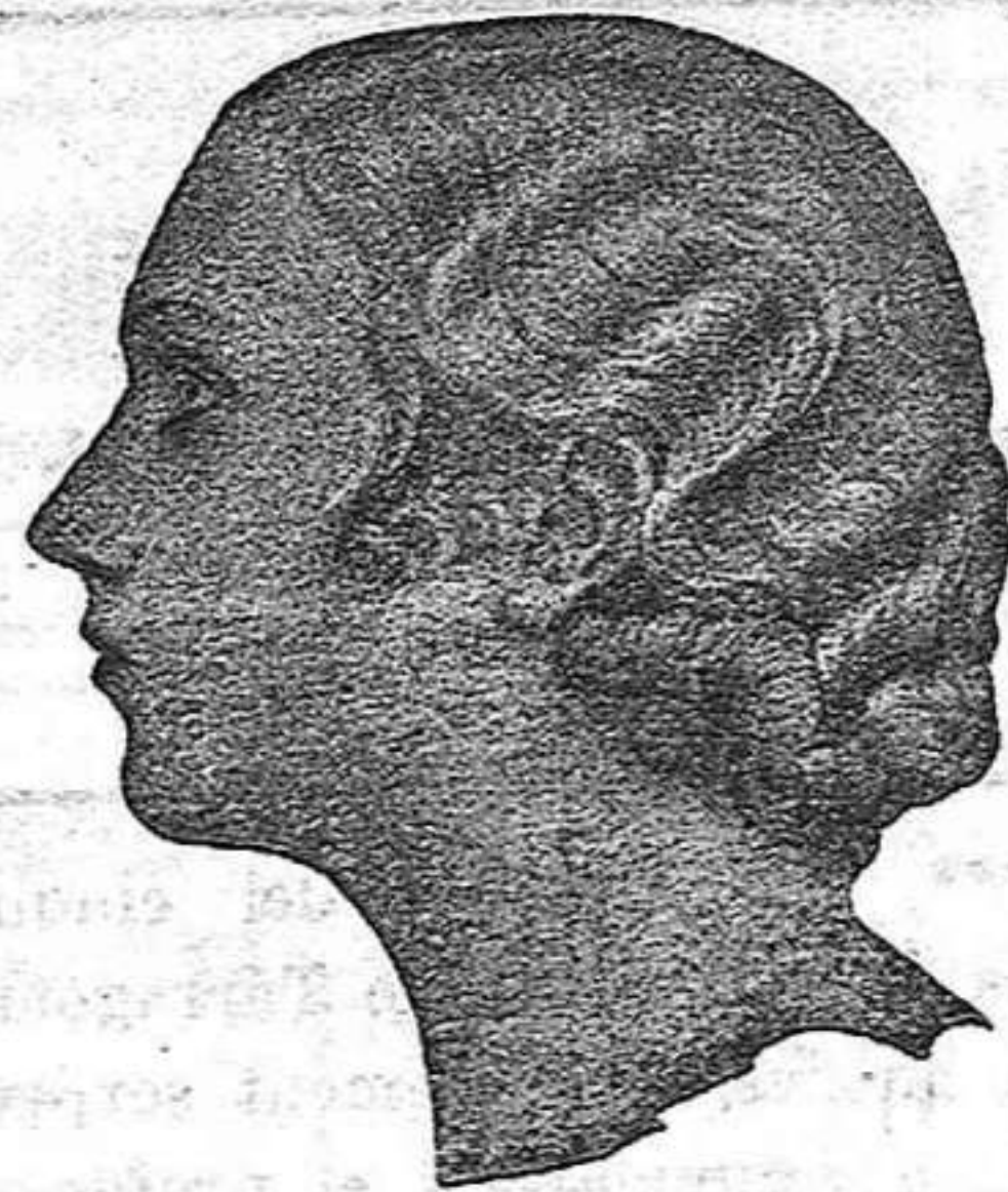
Carrer de Jesús, 28 REUS