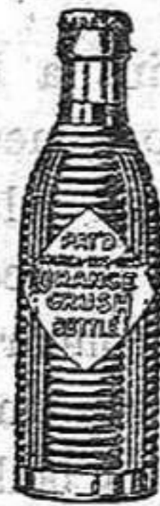
(Marca, botella y nombre registrados)

Ezija siempre la botella original y rechace imitaciones.