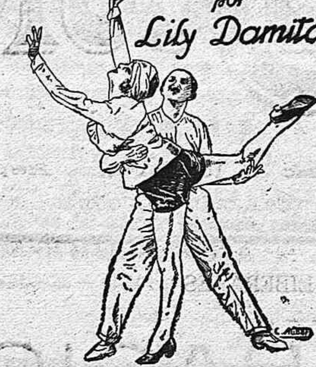
Selecciones Balart y Simó