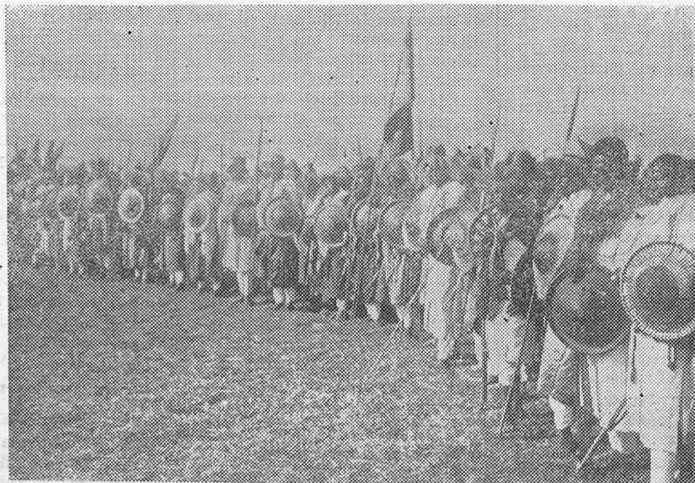
Continúan en Abyssinia e Italia las preparaciones para una posible guerra. Una compañía de soldados de Abyssinia entrenándose con su típico armamento.