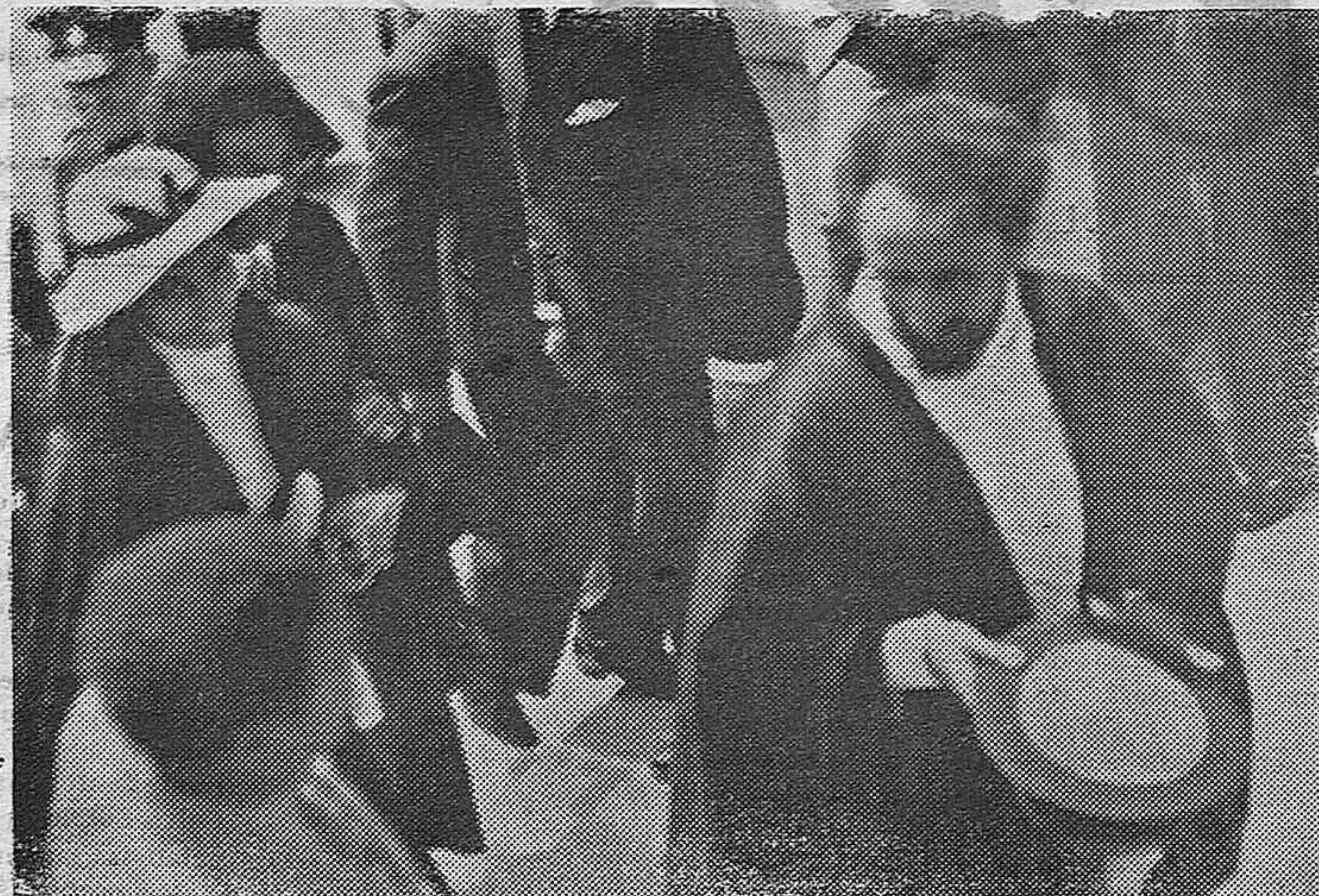
El Negus durante sus entre vistas oficiales que ha celebrado en Gibraltarr, ha visitado también al gobernador británico. El Negus acompañado de su hija la princesa Saia, saludando a la multitud que lo aclamaba a su paso.