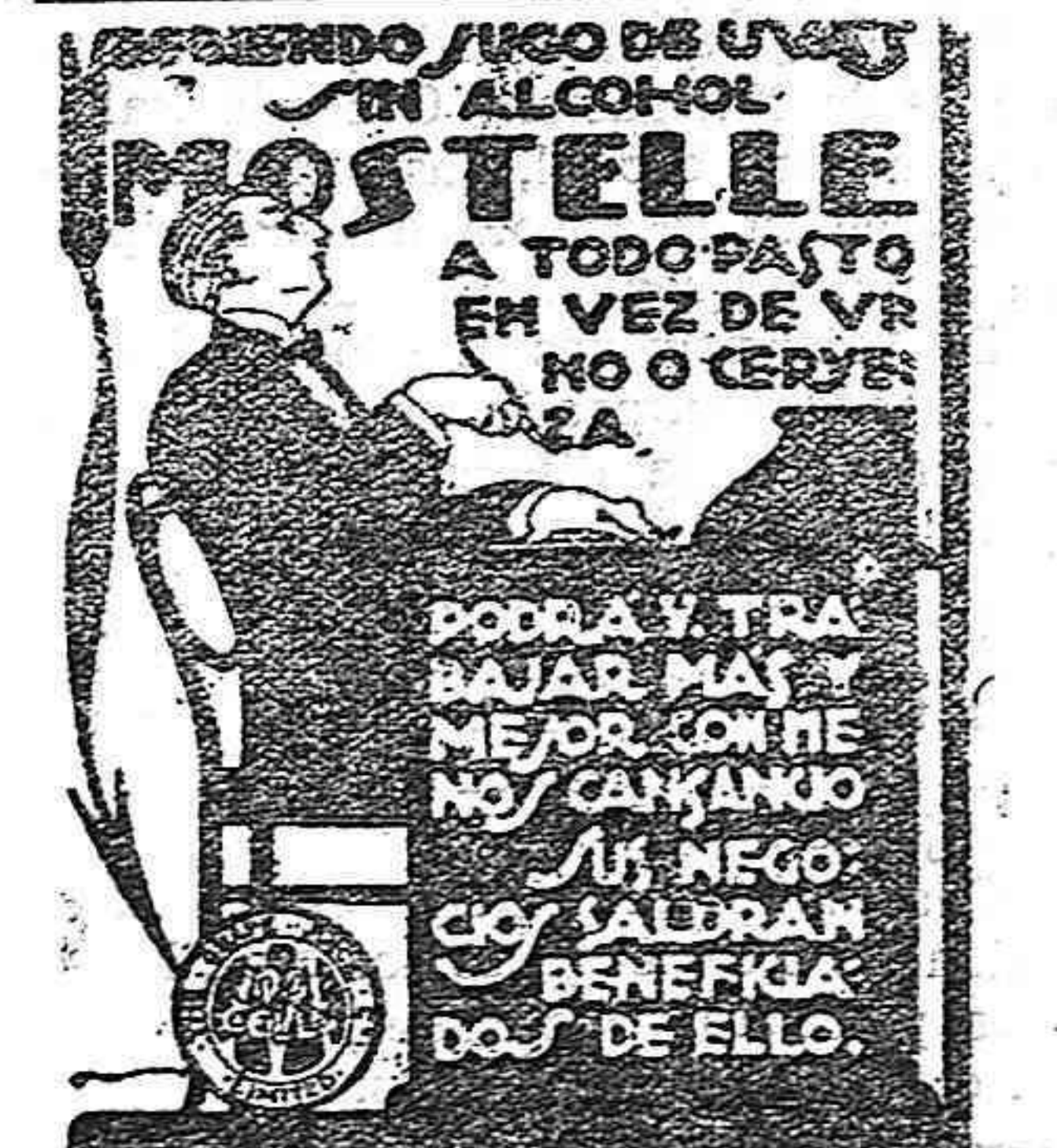
RAFAEL ESCOFET — TARRAGONA

Como se vé, el rescate va siendo difícilísimo.