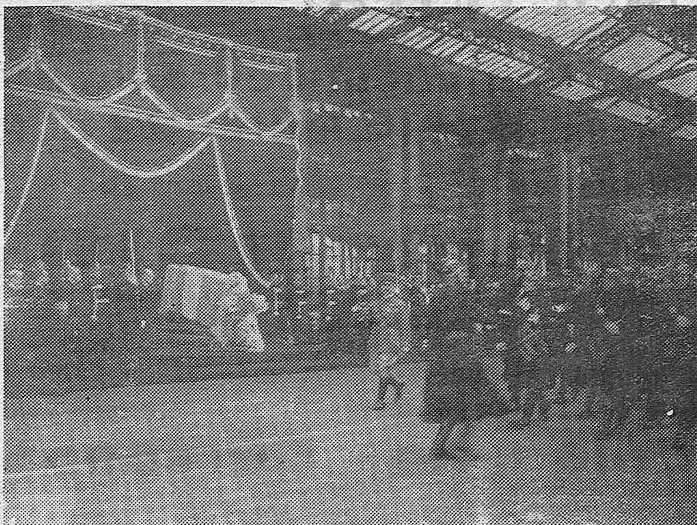
En un tren-furgón ha salido de la estación de Paris con dirección a Grecia el féretro conteniendo los restos mortales del discutido hombre de Estado de Grecia Sr. Venizelos. Antes de salir el féretro de la estación ha tenido lugar una ceremonia, durante la cual han sido tributados los honores militares al antiguo presidente del Consejo de Grecia. La tropa rindiendo honores ante el féretro de Venizelos.