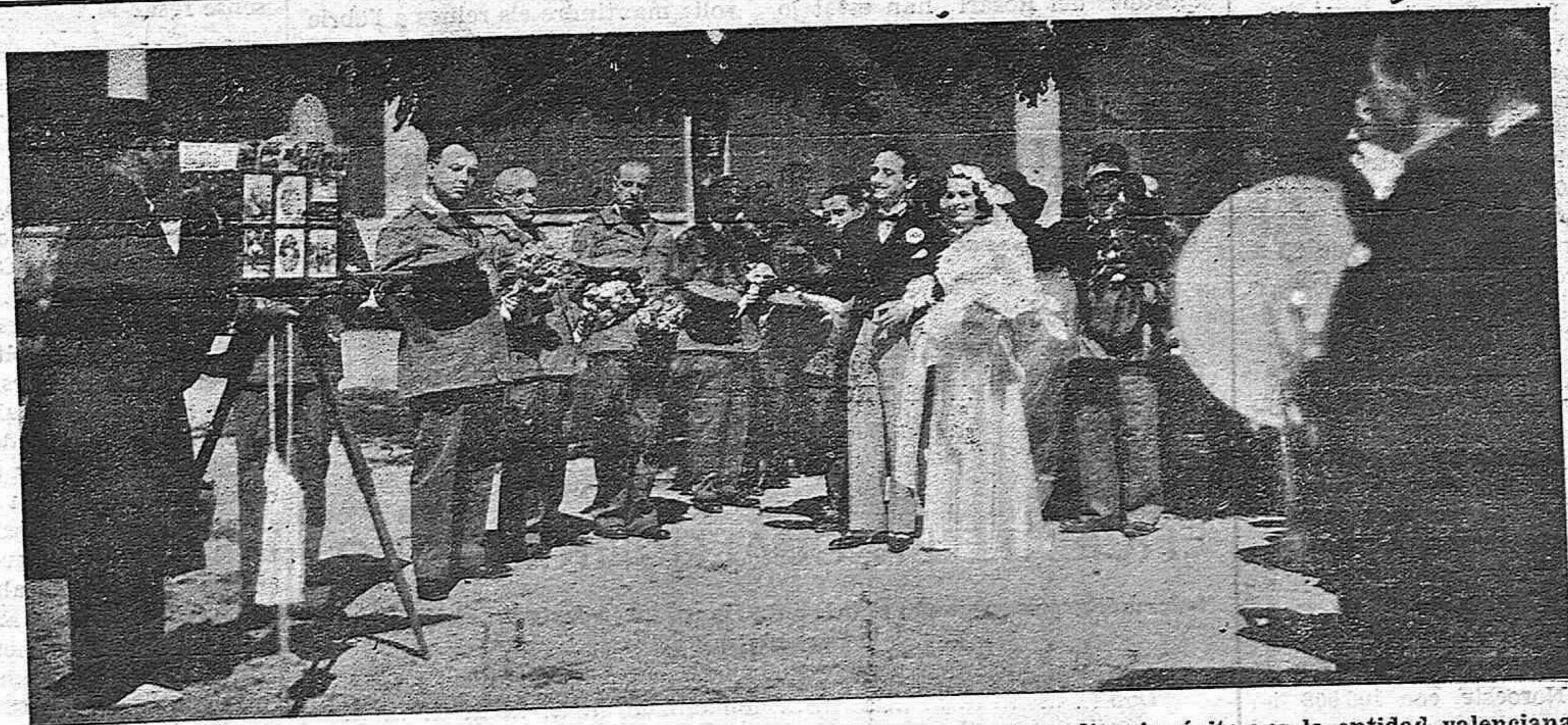
Una escena de la película de Maroto "La hija del Penal", presentada con extraordinario éxito por la entidad valenciana "CIFESA"

La recaudación de otras salas del mundo puede calcularse en tres veces la de los Estados Unidos. Con ello llegaríamos a la cifra de unos 30.000 millones de pesetas.