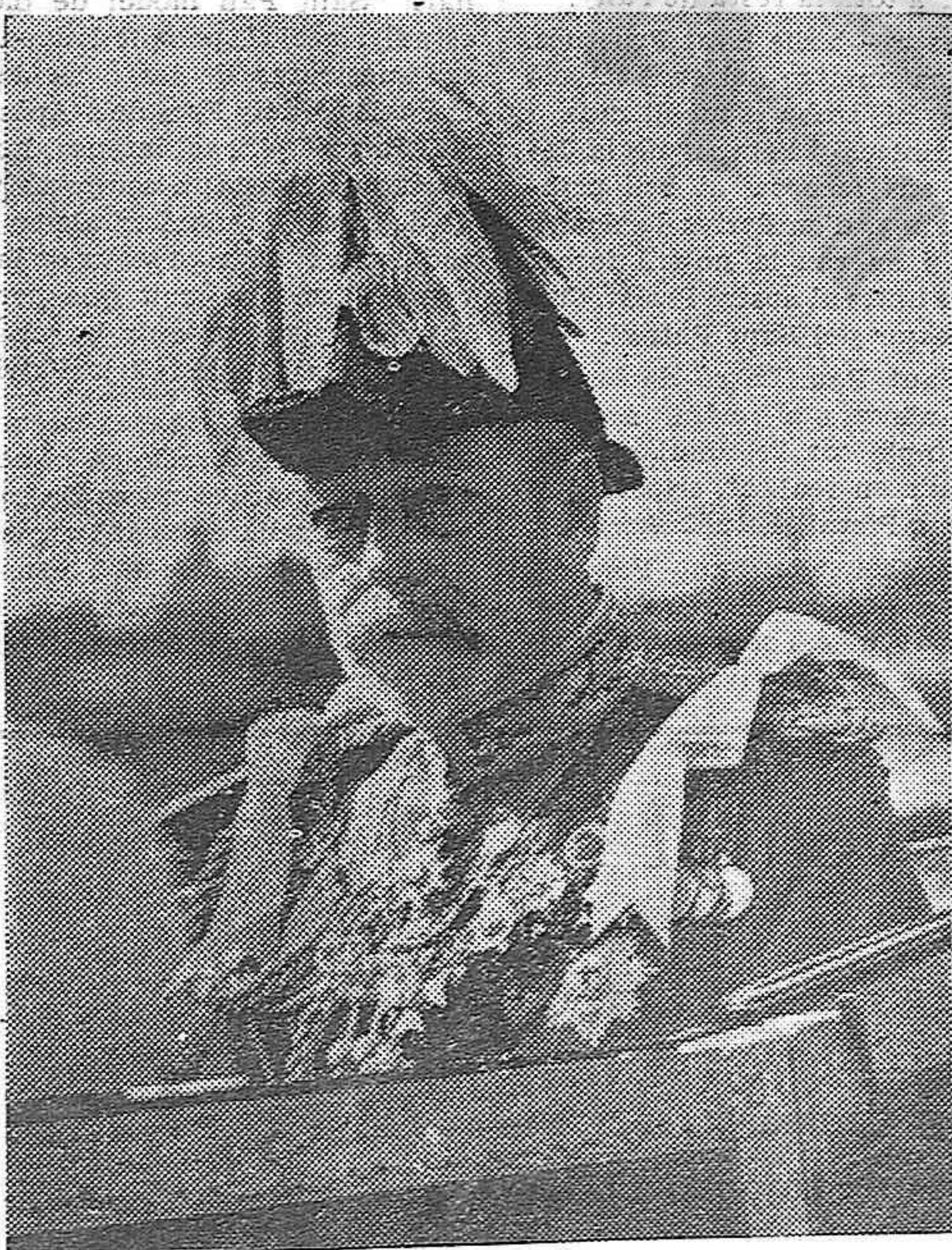
S. M. el Rey de Inglaterra, Jorge V, (e. p. d.), en uniforme militar recorriendo las calles de Londres, cuando se celebraban grandes fiestas con motivo del jubileo real.