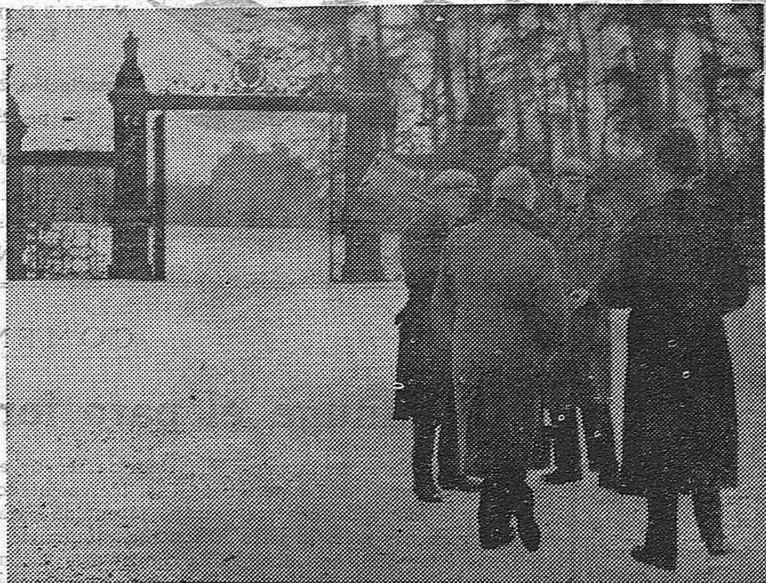
A la edad de 71 años ha fallecido en el castillo de Sandringham rodeado de su esposa e hijos Jorge V, Rey de Inglaterra. -- Obreros ingleses ante la reja del castillo de Sandringham preguntando a un guardia por el estado del soberano.

miento, bajo amenaza de estarles en el acto.