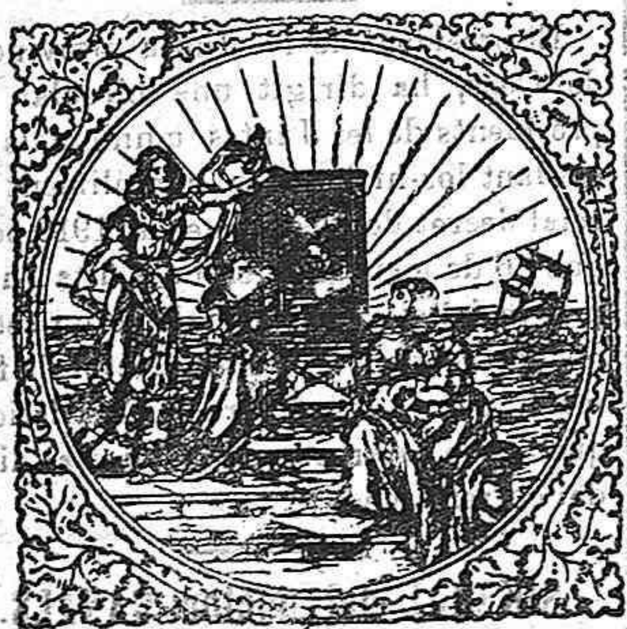
TOTS PER A UN. UN PER A TOTS

Anunci aprovat per la Comissaria General de Segurs