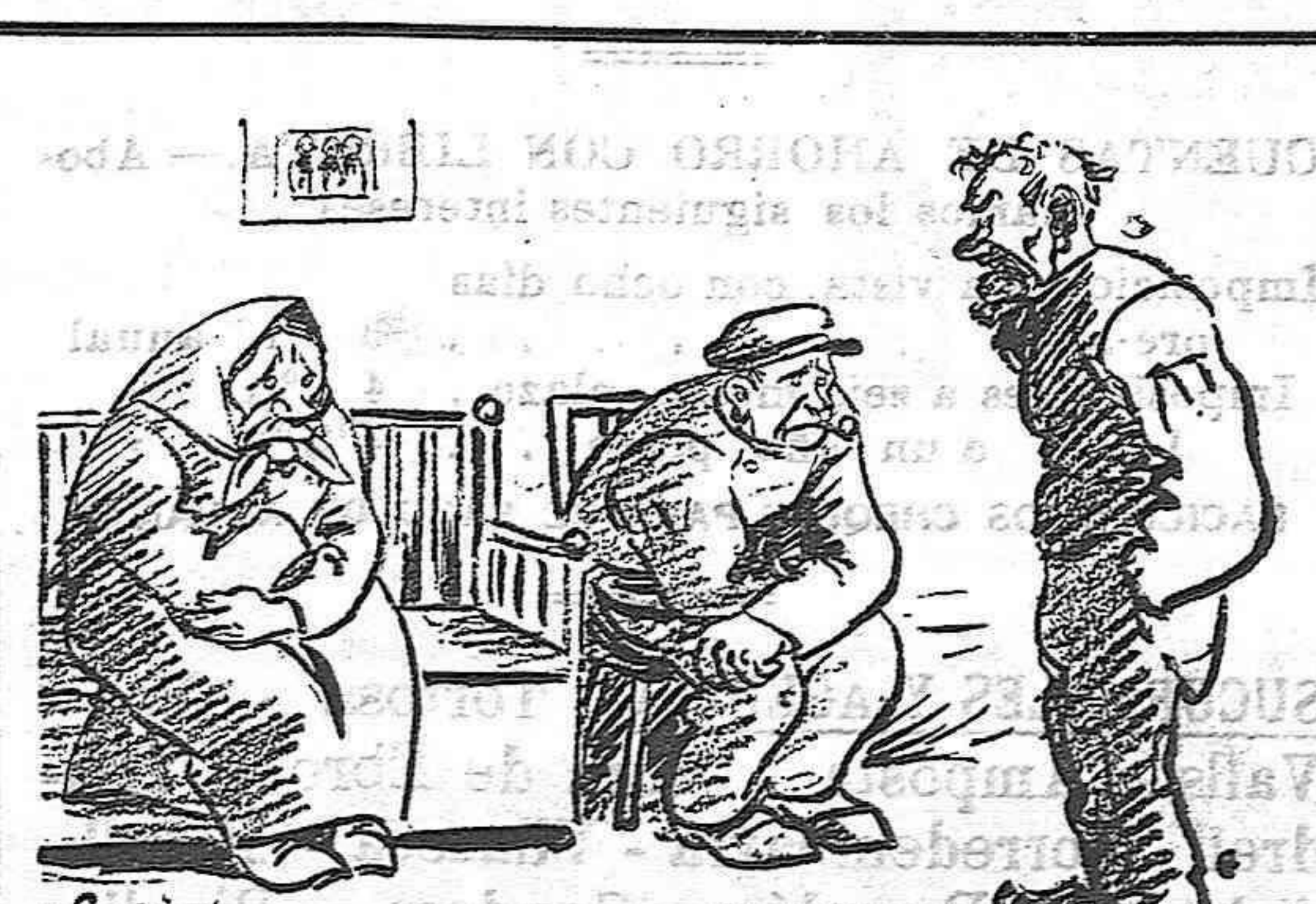
El que está de pie.— Parece extraño que digan que la peseta está baja. Si estuviera tan baja como dicen ya me hubiera agachado a recoger alguna porque bien las necesito, pero está tan alta que no la alcanzo ni con avión.

Se solicita del Gobierno que proceda en breve a una revisión de los aranceles de Aduanas a fin de darles un amayer elasticidad que permita obtener en el Extranjero derechos m's reducidos para nuestros vinos. Al mismo tiempo, se desea que el sistema de un asegunda columna del arancel concebida de manera rígida y única se sustituya por el sistema de derechos consolidados para las partidas que interesan a la exportación española. Se pide, también, que se establezcan negociaciones para aquellos países que apliquen sus derechos arancelarios sobre el peso bruto de las bebidas alcohólicas para que en lo futuro estos derechos recaigan sobre el peso neto y que en los Tratados que se concier-