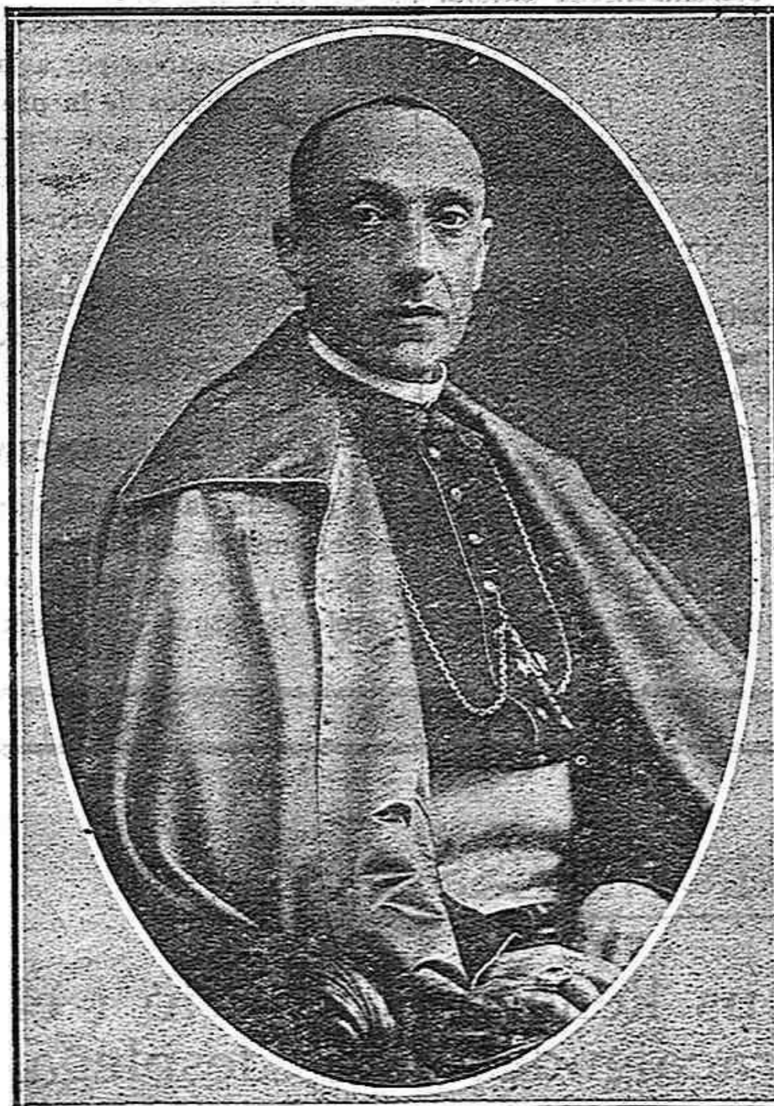
L'Emm. Sr. Cardenal Arquebisbe de Tarragona, a qui els fejocistes prometen filial adhesió