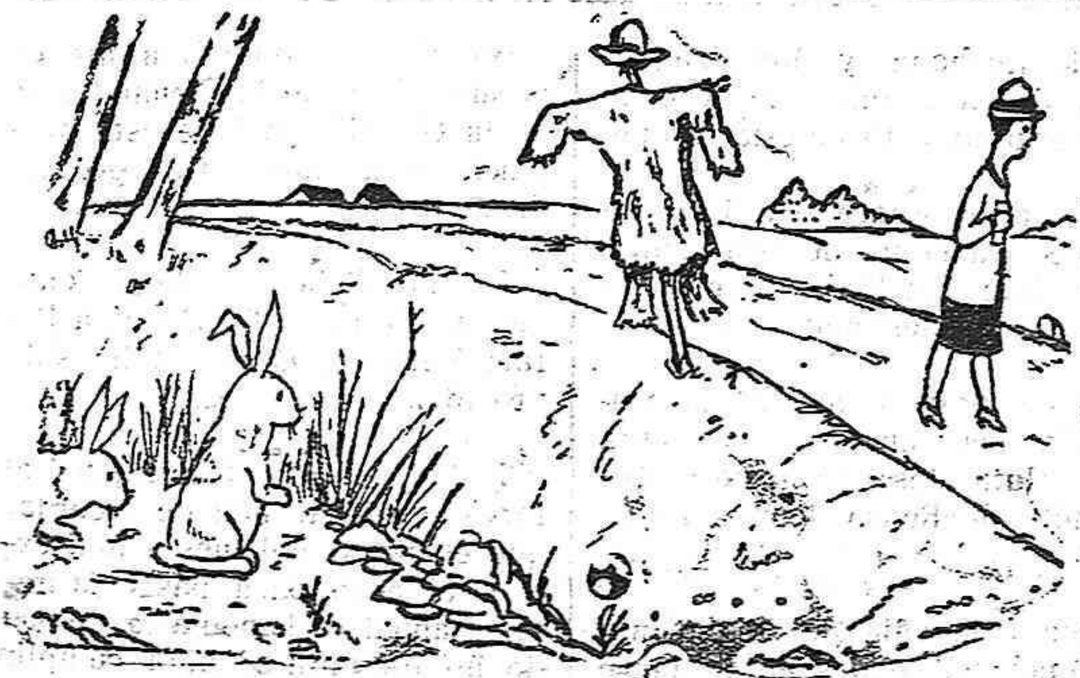
Un conill.—Creus tu que és un home de bó de bó? L'altre.—No. Un home de veritat s'hauria girat per a mirar la noia.

Este número ha sido sometido a la previa censura gubernativa