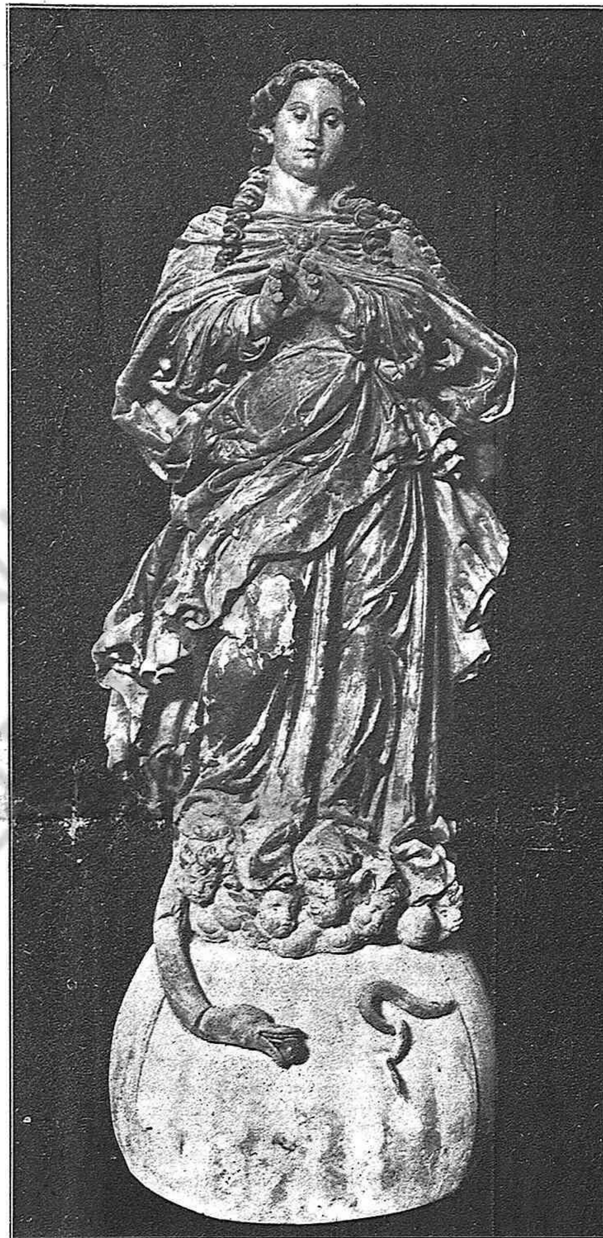
Magnífica escultura del tamaño mayor que natural, del Museo Diocesano, que había pertenecido antes a la parroquia de San Francisco de nuestra ciudad.