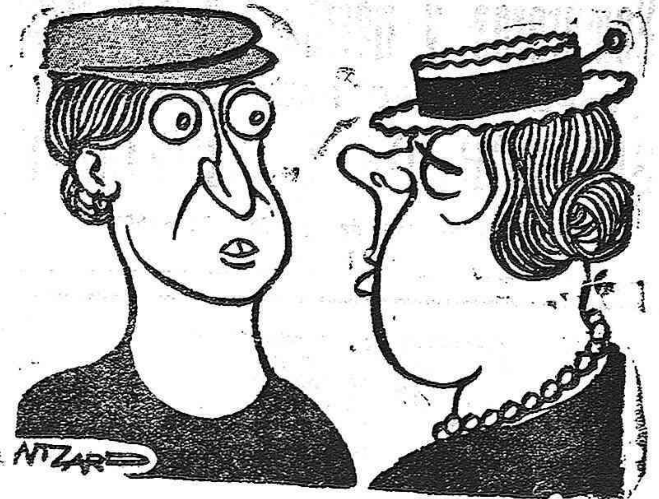
Com es cobriran la testa els respectius marits?

—Després d'estudiar tres anys només saps contar fins a 10. Quin ofici podràs fer? —Arbitre de boxa. (De Il Travaso, Roma)