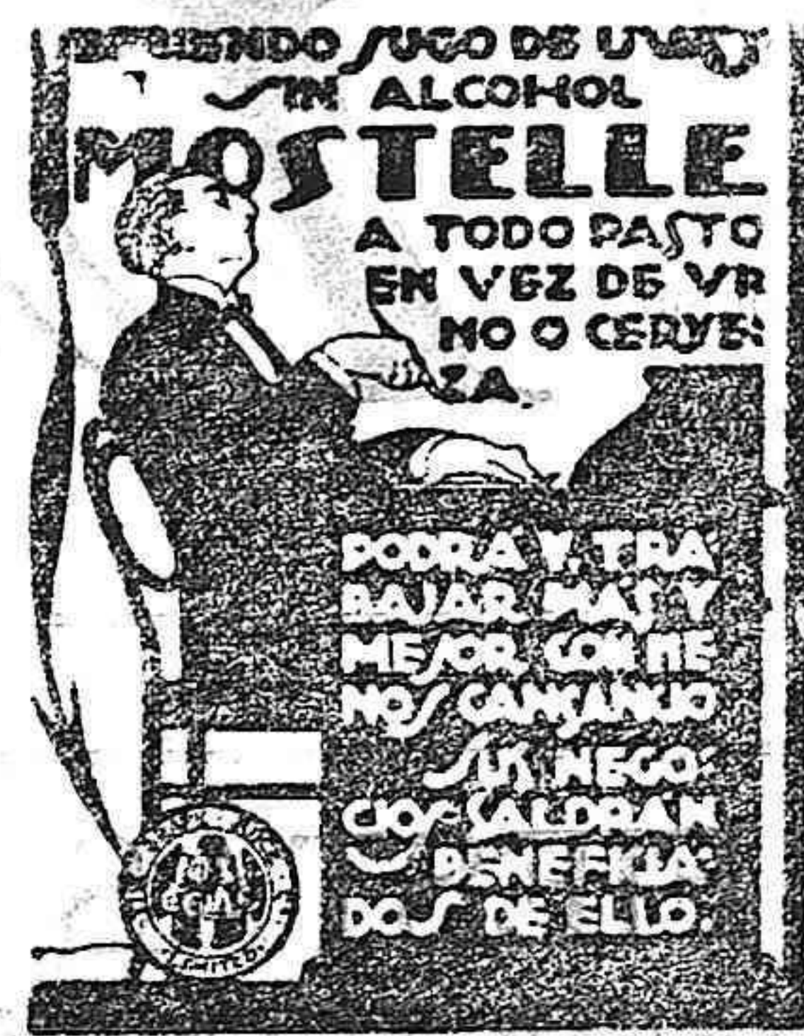
Rafael Escofet - TARRAGONA

Se han distribuido hermosos programas entre los devotos del Santo a fin de que resulten esplendorosos los piadosos actos.