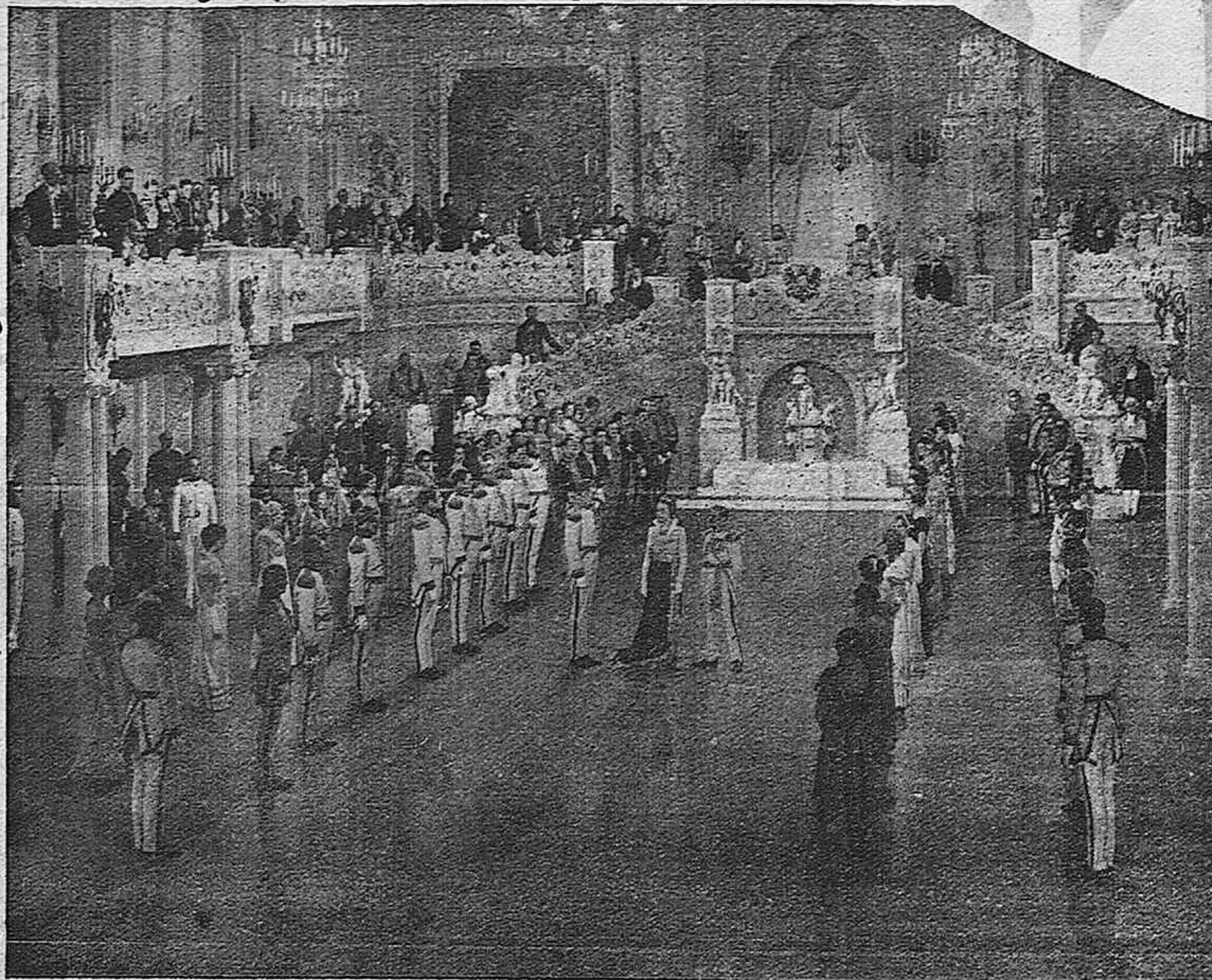
Una de las brillantísimas escenas de la producción B. I. P. "A llegar la primavera" que distribuye la marca Cifesa.

Aquesta magna producció ha obtingut un èxit indescriptible en l'Ufa Palast, de Berlín, on es projecta des de fa diverses setmanes.