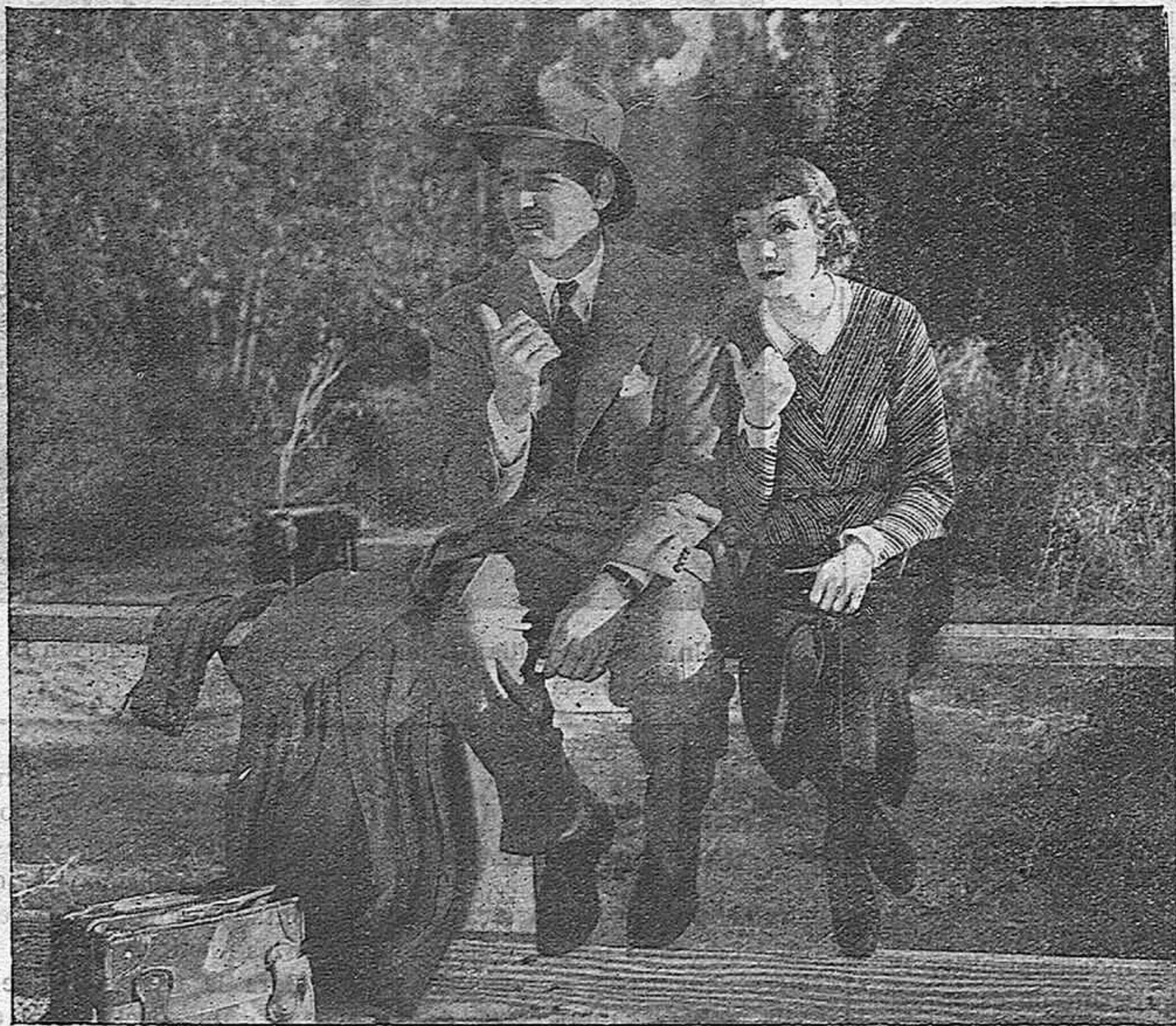
Clark Gable y Claudette Colbert en la película "Sucedió una noche" de Cifesa.

Es impossible, però, voler donar en poques ratlles una idea concreta del què és Chaplin com actor. Un estudi un xic detingut de les seves activitats en aquest terreny artístic, ocuparia, ben segur, i no pas massa còmodament, un gros volum. I una exposició completa d'aquesta i de les restants manifestacions artístiques condensades en Chaplin necessitaria temps i molts llibres en blanc per a emplenar. No en va Chaplin és, dintre el cinema, l'exponent màxim, condensació de totes les activitats cinematogràfiques hagudes fins a la data.