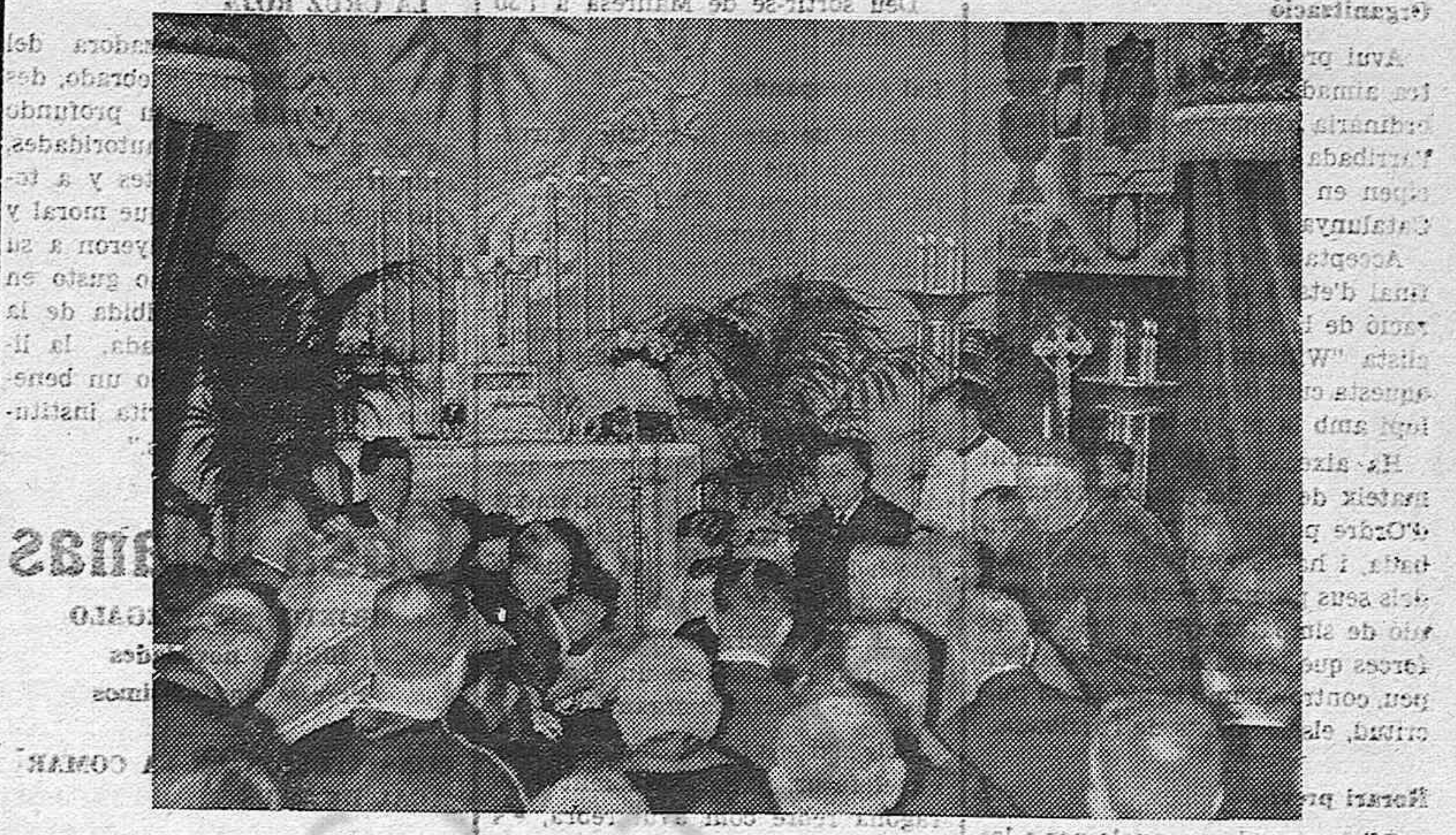
Recientemente ha tenido lugar la bendición de la capilla del gigantesco paquebote "Normandie". Una vista de la ceremonia de la consagración de la capilla, la que efectuó Mons. Verdier. (Express-Foto)