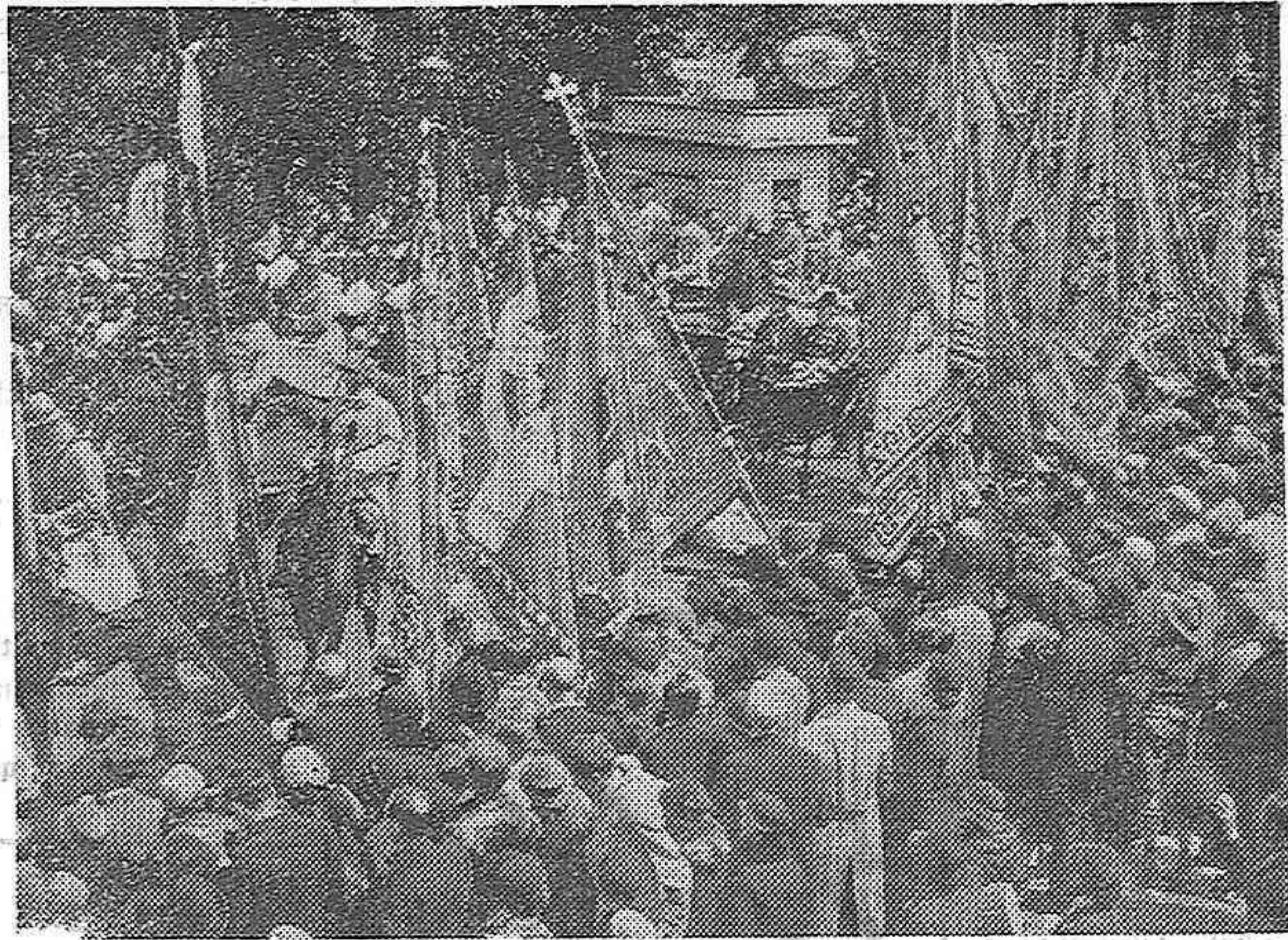
El Cardenal Pacelli, legado del Papa a su llegada a Lourdes para inaugurar las ceremonias del Triduo, fué obsequiado con una solemne recepción. -- El Cardenal Pacelli y su cortejo pasando por las calles de Lourdes.