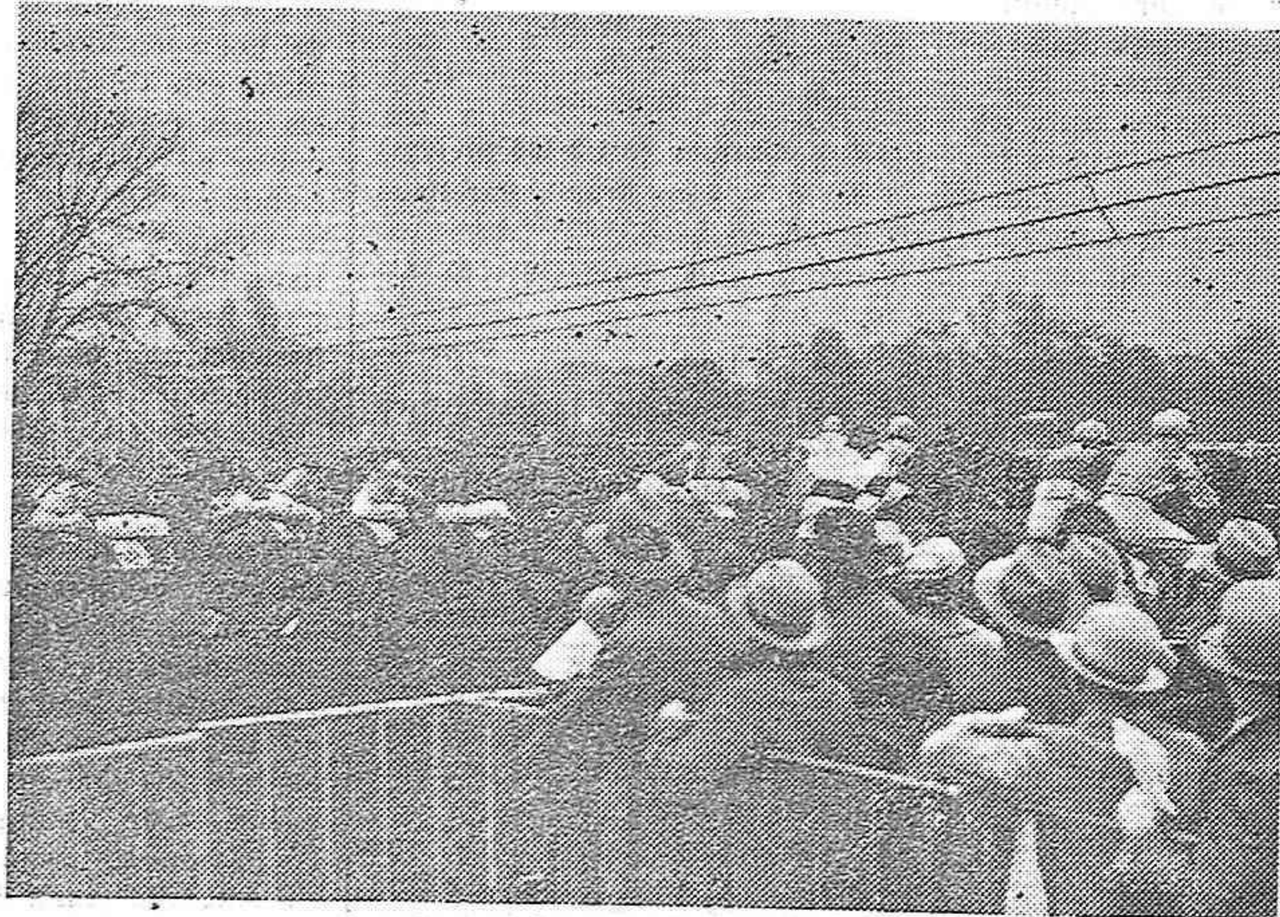
A pesar del mal tiempo la carrera del Premio del Presidente de la República fué presenciada por un numeroso público en Autenuil. El feliz ganador de la bonita suma de tres millones de francos belgas fué el caballo "Bulau". Momento de salir los concurrentes para el premio del Presidente de la República.