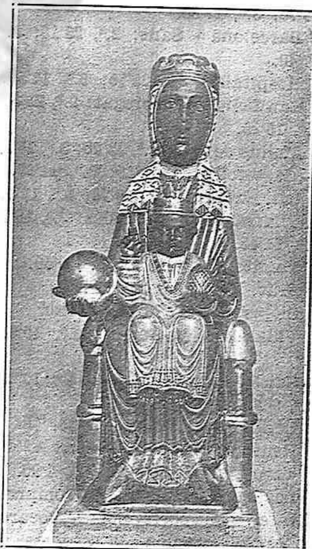
Imatge de la Mare de Déu de Montserrat, que es venera a la Seu de Tarragona

Participem jubilosos en aquesta esplèndida refflorida, Cadascú al lloc que li correspongui o al lloc que li sigui assequible. O sisquera unint-nos, per l'oració, amb els que avui actuen o s'arreglaren en alts combats de fervor, per la recristianització total i permanent de la Pàtria.