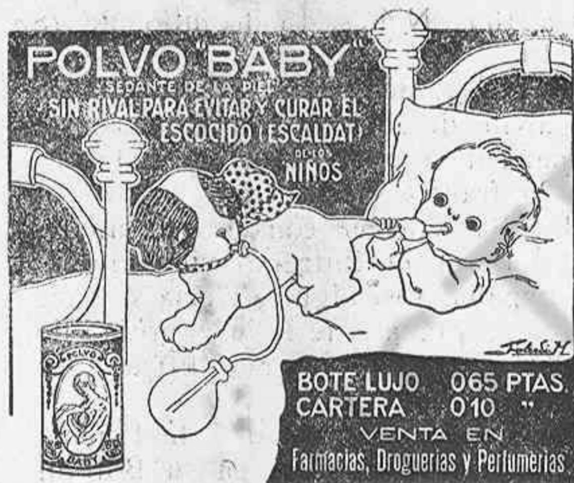
POLVO BABY SIN RIVAL PARA EVITAR Y CURAR EL ESCALDATI EN NIÑOS BOTE LUJO 065 PTAS. CARTERA 010 VENTA EN Farmacias, Droguerías y Perfumerías.

Les altres pessas, que l'autor te aprovades les envia, copiades a ma, amb sa firma y signell a qui les demanti.