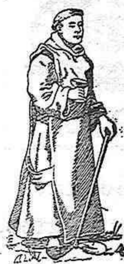
La naturaleza produce todo lo necesario al hombre para nutrirse, vestir y curarse.

(llamada de SANTÉ) de los ABATES TRAPENSES Compuesta únicamente de plantas medicinales