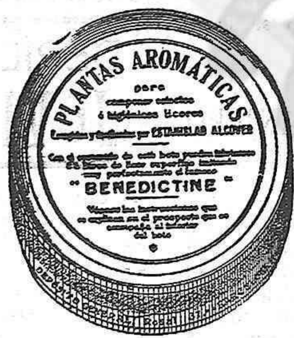
Facsimil del bote

Para la preparación, con el sólo concurso de vegetales de SELECTOS E HIGIENICOS LICORES similares a las más acreditadas marcas.