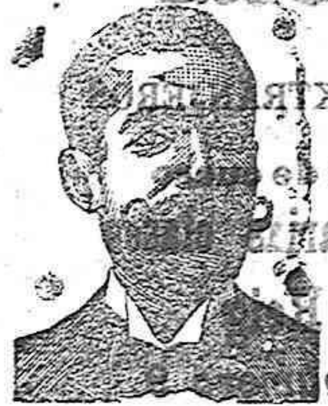
A. COSTANZI Calle de Diputación 435. BARCELONA

Ó INYECCION ANTIVENÉREOS COSTANZI Y ROOB ANTISIFILITICO