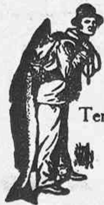
Obténgase siempre la Emulsión con esta marca "El Pescador", marca del procedimiento Scott.

de aceite de hígado de bacalao é hipofosfitos de cal y sosa cuyas intensas propiedades nutritivas se derivan de su alta pureza y actividad de sus ingredientes y de la perfección de su elaboración.