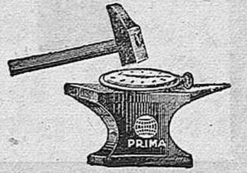
SE COLOCAN AL DIA

Esta es la mejor surtida.—Precios sin competencia.—No comprar sin antes consultar los precios a la CASA RIPOLL Talleres de JOYERÍA y RELOJERÍA, los montados con más adelantos. Hora oficial en el escaparate