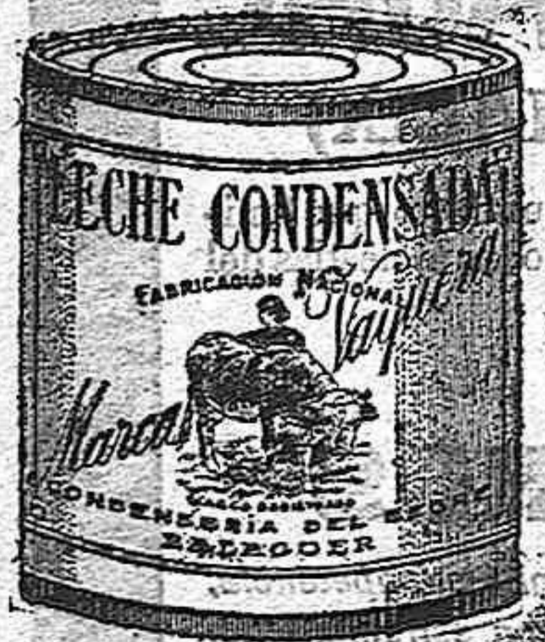
Exijase siempre esta marca

LA MEJOR DE PRODUCCION NACIONAL PUREZA ABSOLUTAMENTE GARANTIDA CONTIENE TODA SU NATA