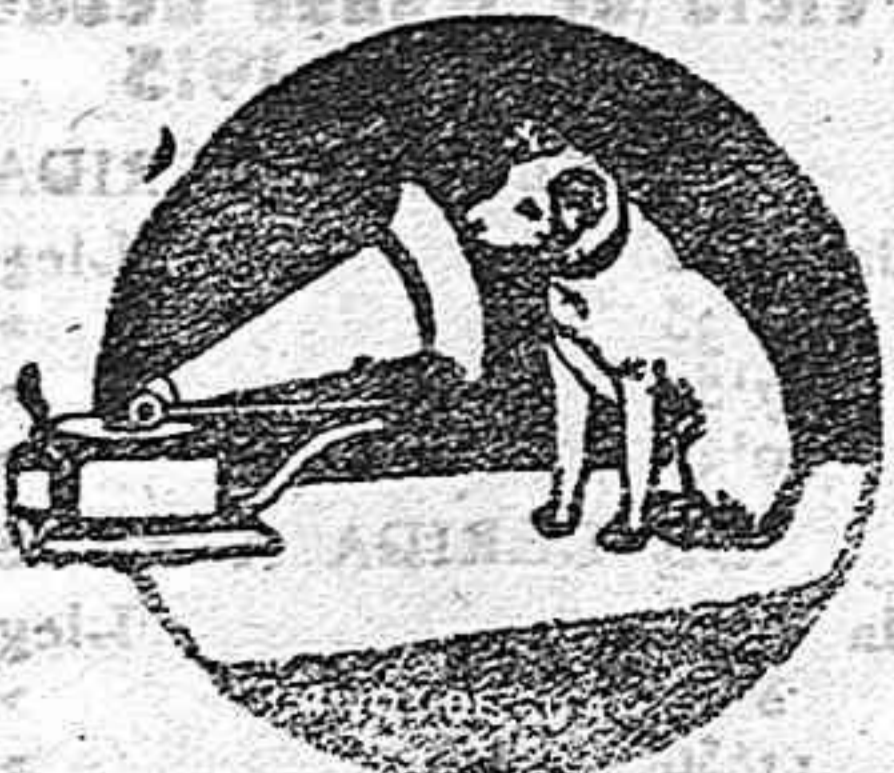
el aparato NO es un GRAMÓFONO Catálogos gratis

DE VENTA: R. ERPIÑA Calle Mayor, núm. 22. - REUS. Despacho 25, pral.