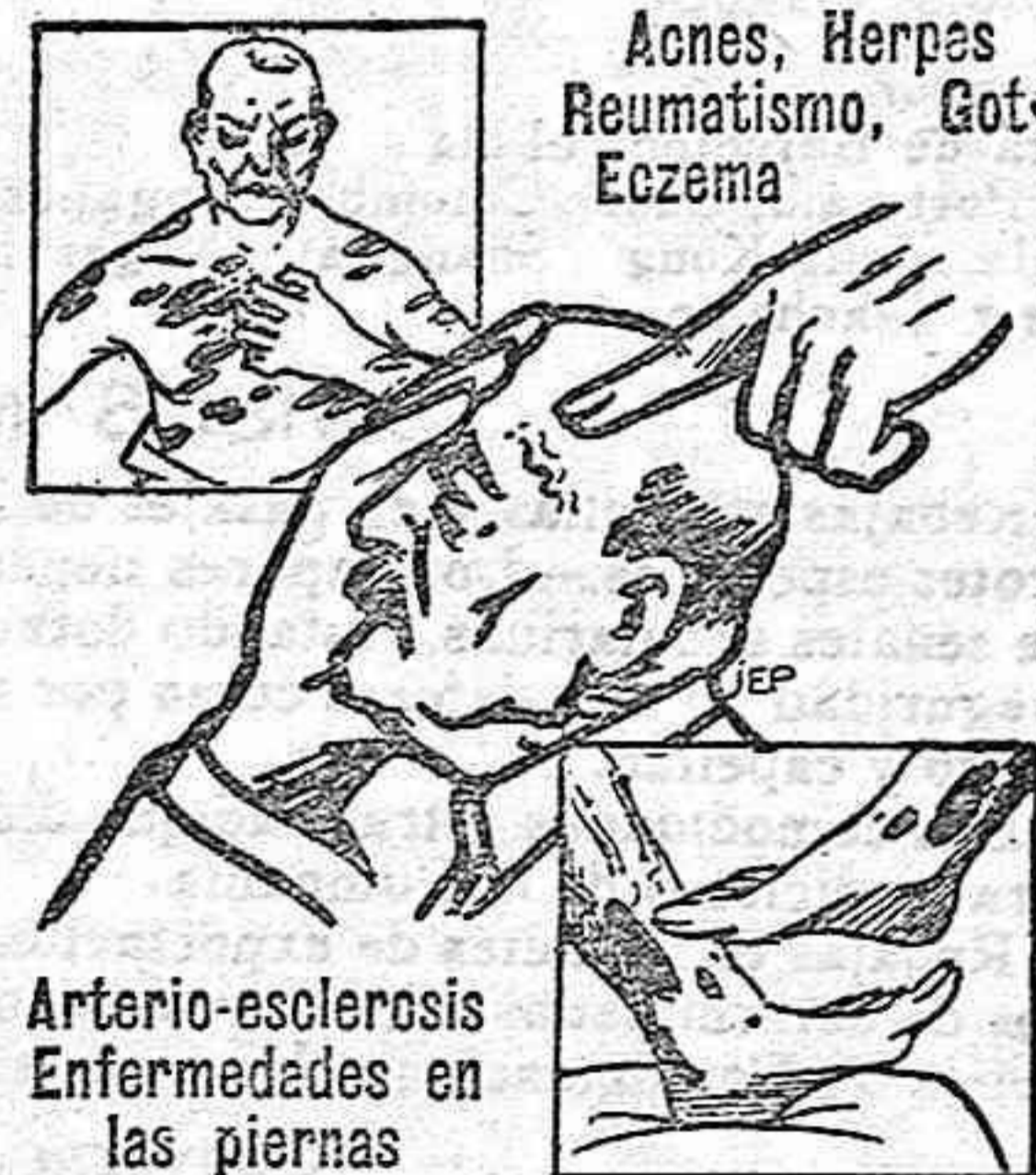
Acnes, Herpes, Reumatismo, Gots, Eczema